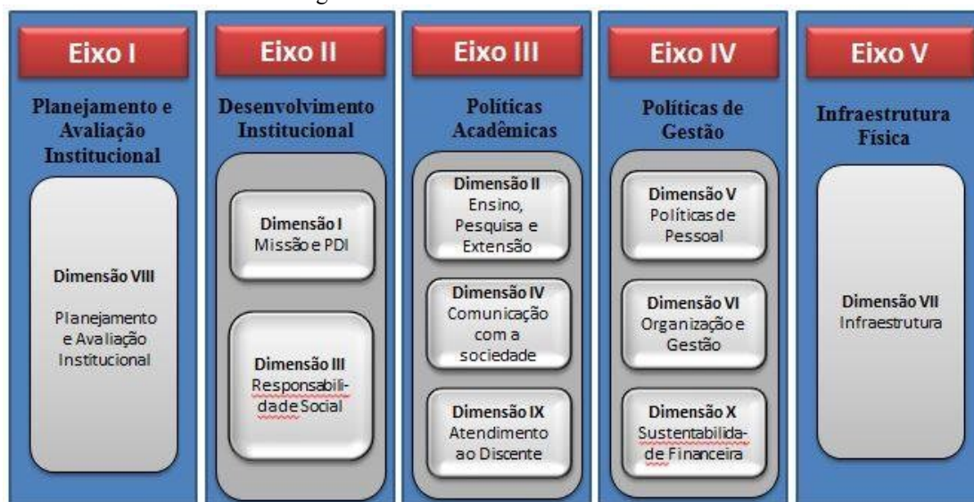
Figura 1: Eixos e Dimensões dos SINAES