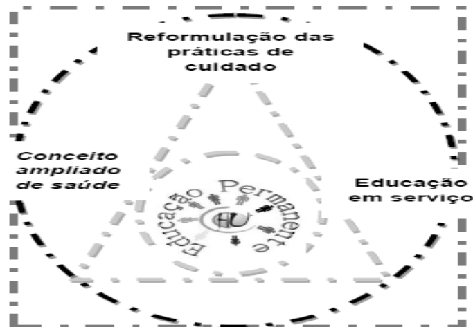
Figura 2- Modelo esquemático para o trabalho em Educação Permanente realizado no Hospital Universitário Dr. Miguel Riet Correa Jr, Rio Grande/RS, Brasil, 2013.

Assim, não somente temas como DCNT são retratadas pelo Setor, mas outras necessidades da instituição, delimitando estratégias de cuidado e visando o aperfeiçoamento dos profissionais de saúde. Para isso, o Setor conta com uma metodologia educativa variada, como o uso de tecnologias de mídia e a videoconferência (Rede Universitária de Telemedicina/Telessaúde), uso de quadro e acesso a internet. Ferramentas essas que facilitam o ensino-aprendizagem; estimulam os profissionais a buscarem a atualização e promovem a interação profissional e acadêmica.