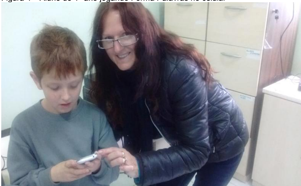
Figura 4 – Aluno do 1º ano jogando Forma Palavras no celular

Usando novamente as mesmas ferramentas, realizou-se outra atividade com o apoio do site específico de jogos educativos Escolagames voltada para alfabetização com alunos do 1º ano A do Ensino Fundamental. O jogo escolhido foi Forma Palavras. A seguir apresentamos alguns registros fotográficos das crianças desenvolvendo as atividades, todos devidamente autorizados pelos responsáveis das crianças.