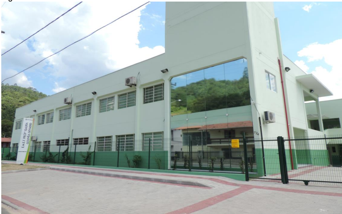
Figura 1 - Foto da frente da escola.

A escola em estudo é a Escola de Ensino Fundamental Professora Isaura Gouvêa Gevaerd situada à rua José Dubiela, 724, bairro Tomaz Coelho, Brusque-SC. Ela é composta de aproximadamente 435 alunos, desde o infantil I integral até o 9º ano.