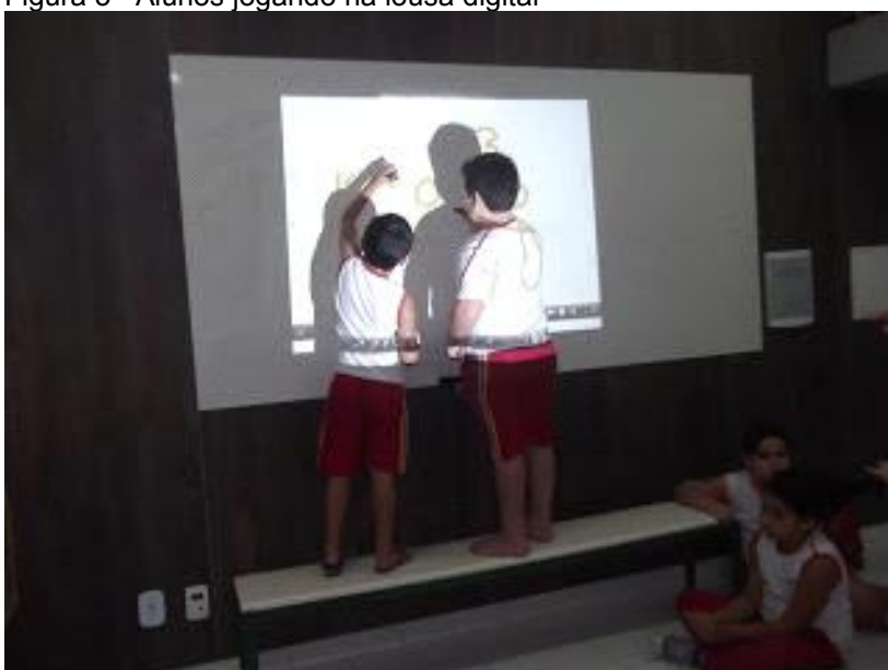
Figura 3 - Alunos jogando na lousa digital