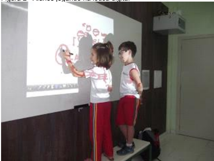
Figura 2 - Alunos jogando na lousa digital

A seguir destacamos alguns desses momentos. Consideramos importante registrar que os alunos em destaques são do 4º ano A matutino, e que foi concedida autorização de imagem de todos eles, já no ato da matrícula de 2016, pelos seus responsáveis legais no início do ano.