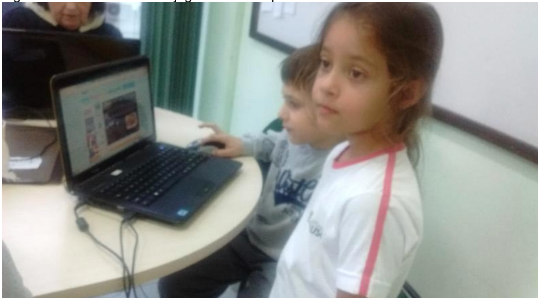
Figura 5 – Alunos do 1º ano jogando no computador