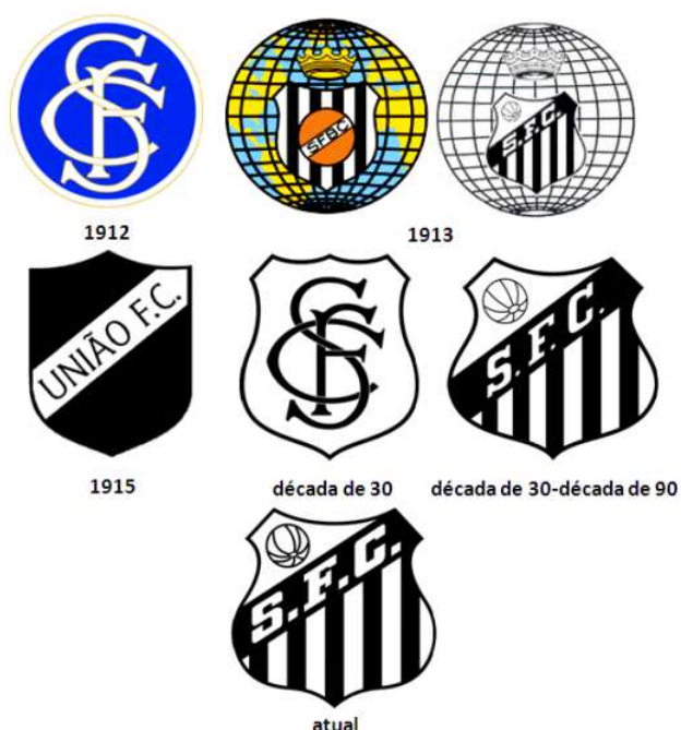
Figura 09 – Evolução do Símbolo do Santos

Já no dia 31 de março de 1913 o clube decidiu alterar as cores para o tradicional branco e preto, utilizando o uniforme com calção branco e camisa listrada preta e branca. Uma das figuras mais importantes da história do clube foi Urbano Vilella Caldeira Filho, foi atleta, técnico, dirigente e patrono do clube. O Estádio Urbano Caldeira, mais conhecido como Vila Belmiro, leva seu nome, em homenagem ao grande amor que demonstrou ter pelo clube.