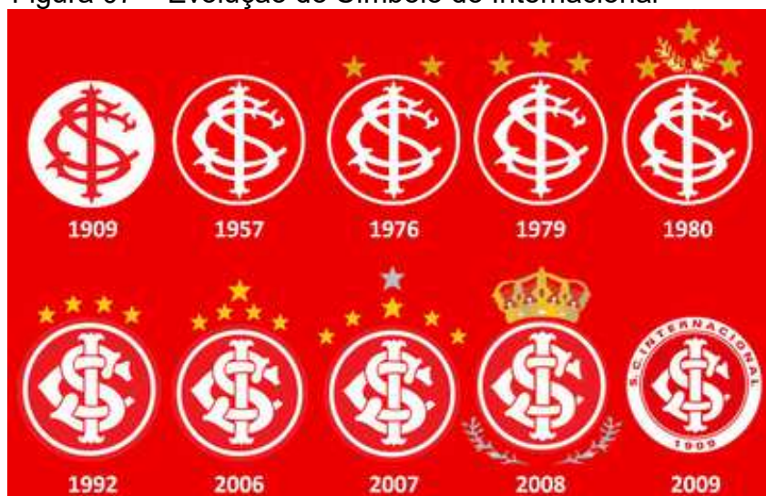
Figura 07 – Evolução do Símbolo do Internacional