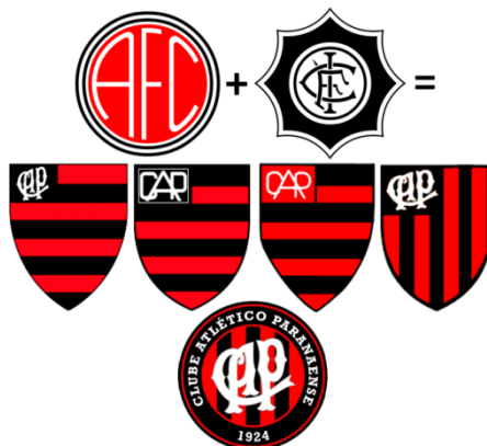
Figura 03 – Evolução do Símbolo do Atlético PR

Segundo o site do Clube Atlético Paranaense (2016), em 26 de março de 1924, através da fusão do Internacional Futebol Clube e do América Futebol Clube, surgiu o Clube Atlético Paranaense (Figura 03), criado para fazer frente ao Britânia Futebol Clube, que em 1923 havia conquistado seis campeonatos paranaenses seguidos. Utilizando as cores vermelho e preto é conhecido como rubro-negro, outro apelido concedido pelos fãs é o de “Furacão”. Possui um dos estádios mais modernos do Brasil o Joaquim Américo Guimarães, conhecido vulgarmente por Arena da Baixada.