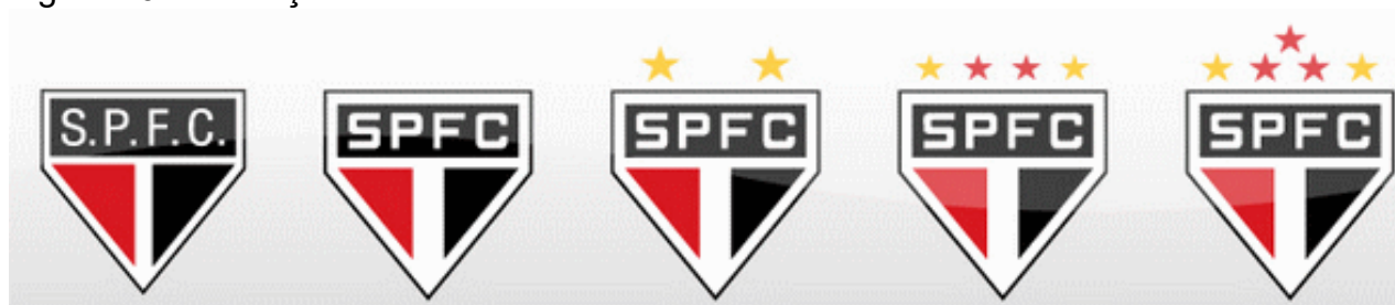
Figura 10 – Evolução do Símbolo do São Paulo