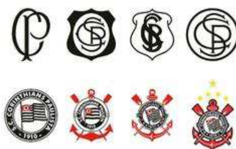
Figura 04 – Evolução do Símbolo do Corinthians

Segundo o site do Sport Club Corinthians Paulista (2016), o grupo de operários constituído por Anselmo Corrêa, Antônio Pereira, Carlos Silva, Joaquim Ambrósio e Raphael Perrone, fundou o Sport Club Corinthians Paulista (Figura 04) em 1º de Setembro de 1910, tendo o nome derivado do clube inglês Corinthian-Casuals Football Club. O primeiro presidente foi Miguel Battaglia que ao assumir falou: “O Corinthians vai ser o time do povo e o povo é quem vai fazer o time”.