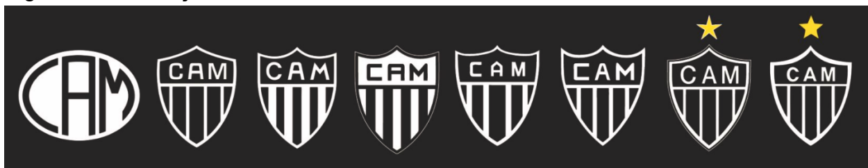
Figura 02 – Evolução do Símbolo do Atlético MG