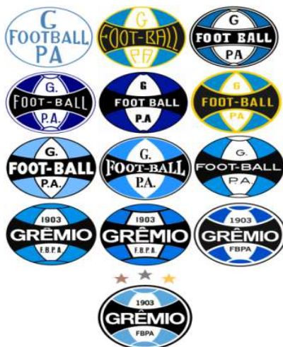
Figura 06 – Evolução do Símbolo do Grêmio