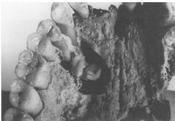
Foto 3. Posición y tamaño relativo de las piezas supernumerarias ectópicas del individuo IP B-24.