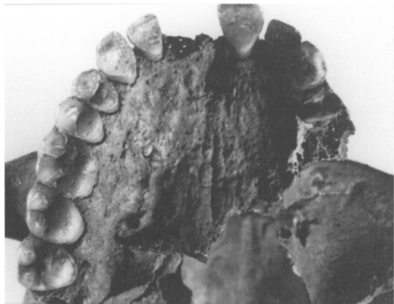
Foto 1. Bóveda palatina del individuo IP B-24 mostrando tres afloraciones de esmalte a nivel del segundo premolar derecho.

En la necrópolis mallorquina de "S'Illot des Porros", se han hallado cuatro individuos con piezas dentarias supernumerarias: un individuo joven que presenta retención de los caninos mandibulares en el interior de sus alveolos; un individuo de sexo masculino y edad avanzada que conserva cinco alveolos en la región incisiva; un individuo de sexo femenino y edad madura en cuyo maxilar se hallan dos molares extras de pequeño tamaño dispuestos simétricamente en la zona vestibular entre el 2º y el 3º molar y, finalmente, el caso objeto de este estudio, un individuo que presenta tres afloraciones de esmalte en la cara inferior de la apófisis palatina del maxilar derecho (Foto 1). Se trata, pues, de dos individuos de sexo femenino, uno de sexo masculino y un individuo joven en los que están involucrados piezas permanentes.