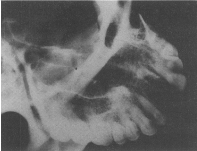
Foto 2. Imagen radiológica en la que se aprecia una condensación a nivel de la raíz del canino y premolares.