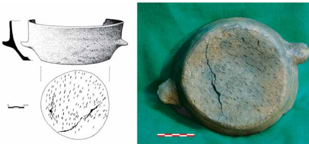
Fig. 2. Recipiente cerámico de la cueva de Armontaitze en el que se documentaron restos de contenido. (Fotografía y dibujo cedidas por A. Armendariz Gutiérrez).

Como se ha expuesto anteriormente, no observamos una aplicación de las técnicas de análisis químico-mineralógicas referida a las cerámicas neolíticas en concreto y a las prehistóricas en general. Sin embargo, y a pesar de centrarse cronológicamente en un período posterior, cabe destacar dentro de nuestro ámbito geográfico el estudio del material cerámico adscrito a la Edad del Hierro en el País Vasco (OLAETXEA 2000). En éste la aplicación de las técnicas químico-mineralógicas contribuyen al conocimiento de la tecnología de elaboración cerámica así como a la delimitación de las áreas de procedencia, realizando un acercamiento a la gestión de los recursos arcillosos por parte de estas sociedades.