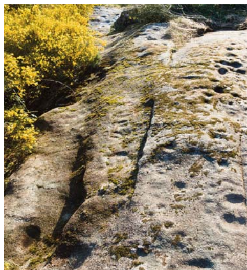
Foto 6. Vista parcial do Panel núm. 2 e 1