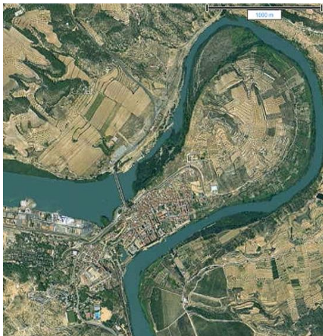
Figura 2. Meandre de Flix, on es mostra la paret de l'embassament i els canals subterranis

Aquesta activitat anà combinada amb la construcció d'un embassament a l'estrada del meandre de Flix (Figura 2). Aquest embassament estava combinat amb dos túnels que travessaven la part estreta del meandre per sota. Un dels túnels estava fet per a passar barques i l'altra per a aprofitar el salt d'aigua que hi ha entre les dues parts del meandre. Així, en travessar l'aigua per sota hi ha un salt que mou una turbina i es genera energia hidroelèctrica. La paret de l'embassament estava dedicada a retenir l'aigua del riu i assegurar un cabal a través de la turbina. Aquest embassament no és un dipòsit d'aigua perquè està fet en una zona que no té capacitat d'emmagatzematge. Malgrat això, la presència de l'embassament fa que l'aigua del riu Ebre quedi retinguda i que s'hi puguin acumular els residus abocats per la planta clor-àlcali. Aquest embassament es construí en un període en què també es construïren els embassaments de Ribarroja i de Mequinença, el primer per emmagatzemar les aigües de l'Ebre i del Segre i el segon per recollir les aigües de l'Ebre i del Cinca. Aquests dos embassaments aigües amunt retenen els contaminants abocats als cursos d'aigua i per tant les aigües alliberades després de l'embassament de Ribarroja tenen concentracions de contaminants molt baixes.