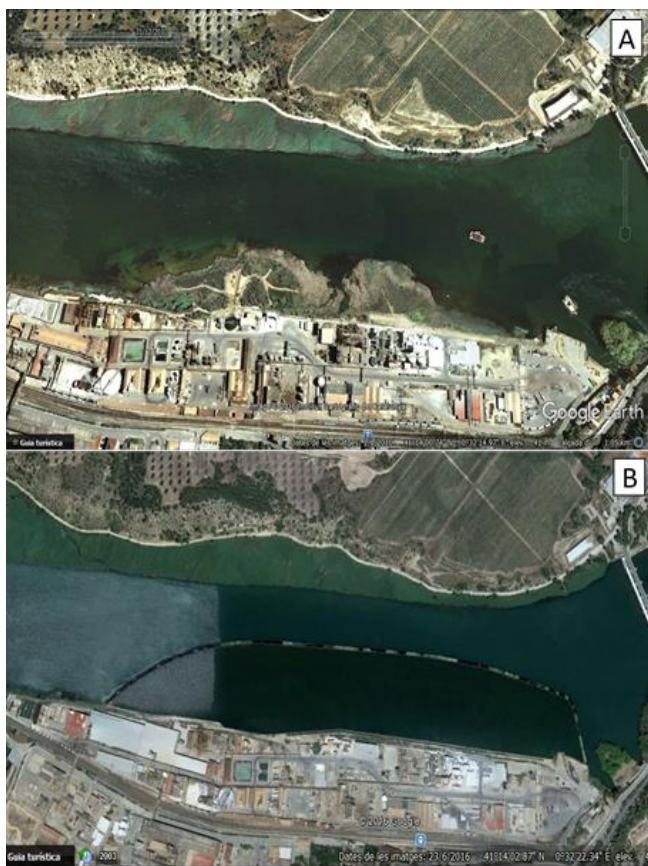
Figura 3. Fotografies del Google Earth que mostren l'embassament de Flix en dates 1/4/2010 (A) i 23/6/2016 (B).

A més d'això, aquests residus tenien mercuri, cadmi (Cd), crom (Cr), níquel (Ni), policloronaftalens, policloroestirens, DDT, policlorobifenils, policloroestirens, hexaclorobenzè, pentaclorobenzè, clorobenzens, percloroetilè i hexaclorociclohexans entre altres.