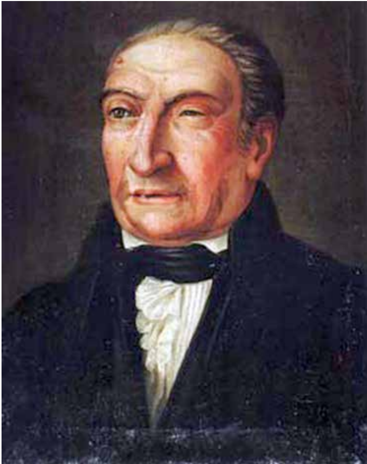
Figura 1. Retrato al óleo de Antoni de Martí i Franquès pintado por el académico Josep Arrau, que se conserva en la Reial Acadèmia de Ciències i Arts de Barcelona (circa 1835).

de Amigos del País 14 , participó en la creación a principio de siglo XIX de la Real Academia de Dibujo y Náutica, y en los esfuerzos hechos durante el trienio liberal para reestablecer en la ciudad estudios universitarios 15 . Asimismo participó en algunos proyectos de notable valor comercial para