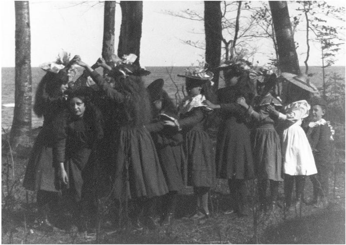
Girls playing London Bridge near New York, circa 1898