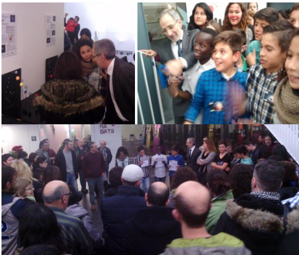
Figura 4: Imatges de l'exposició al Museu i la seva inauguració amb presència de les autoritats locals.

El producte: el resultat final del treball dels alumnes ha estat una exposició de divulgació científica al Museu de Ciències Naturals de Granollers que posa l'accent en les concepcions errònies comentades a la introducció. En la realització final ha estat important pels alumnes que el seu treball acabés exposat en una sala d'un museu, en les converses d'aquests amb els responsables del museu es va parlar molt sobre la importància de les presentacions i dels acabats finals per un treball d'aquestes característiques. L'organització del muntatge "in situ" a la sala del museu també va ser realitzat per l'alumnat amb ajuda dels tècnics del museu; les tasques es van repartir en petits grups d'alumnes amb molt bona implicació de la majoria de tots ells. L'exposició, que va ser objecte d'atenció mediàtica [3], es va inaugurar al museu el dia 21 de desembre de 2015 i va romandre oberta dos mesos, fins a finals de febrer de 2016.