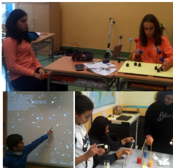
Figura 3: Els alumnes cerquen mitjançant programes informàtics informació sobre les estrelles que formen les constel·lacions i les representen segons la seva tipologia i ubiquen segons la distància respecte a la Terra.