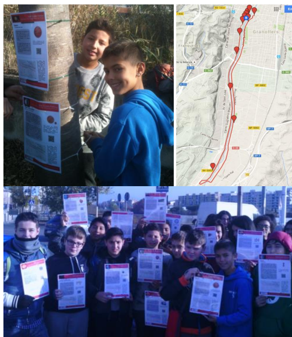
Figura 2: Els alumnes creen panells físics amb informacions sobre la mida que tindria el cos celest en aquest recorregut i l'ubiquen en el lloc que ocuparia. Cada panell conté també una breu presentació del cos celest i un codi QR que condueix a continguts digitals ampliat creats per l'alumnat.

el Sistema Solar (des del Sol al Cinturó de Kuiper) en un recorregut urbà de 10 km, de manera que en aquest itinerari, el passejant parteix de l'inici (representat per el Sol) i es troba al llarg del recorregut els diversos planetes ubicats al lloc que ocuparien i representats en un panell físic a la mida que tindrien. Cada panell conté a més un codi QR que condueix a una descripció divulgativa sobre el planeta creada per els alumnes ubicada en una pàgina web creada ad hoc . Produccions dels alumnes són disponibles per a la seva consulta a la web del projecte: http://solarsystempathway.museugranollersciencies.org/ .