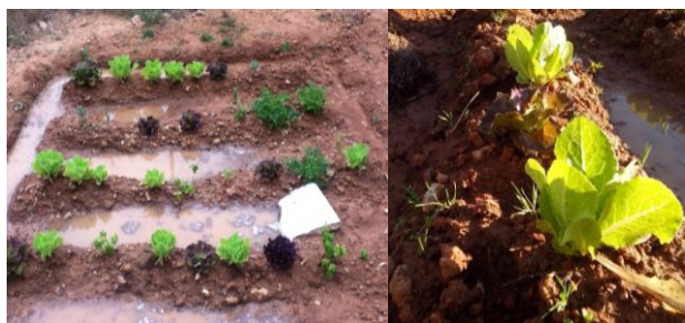
Figura 2. L'hortet, es pot apreciar la gran quantitat de roques que es trobaren i la forma en que dissenyaren els cavallons

La tornada a l'acadèmia i a l'IES amb les plantes (Imatge 1) es realitzà mentre parlaven del que els havia resultat curiós de la cooperativa. En aquest punt la feina a realitzar fou cercar informació del que havien comprat, temps de recol·lecció, nutrients, lloc de procedència, beneficis de la seva ingesta. En aquest punt ens faltava fer la plantació. Part que resultà molt divertida per a la majoria d'alumnes. Cal destacar que alguns no havien tocat mai el fang i al principi els semblava fastigós. (Imatge 2)