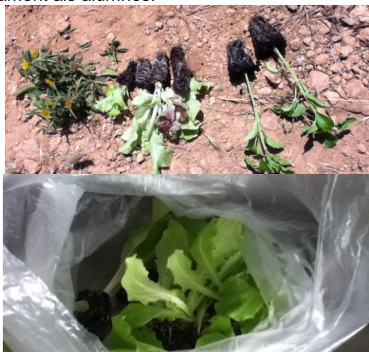
Figura 1. Algunes de les plantes que compraren els alumnes en les cooperatives.

les preguntes, ensenyar les instal·lacions i el funcionament als alumnes.