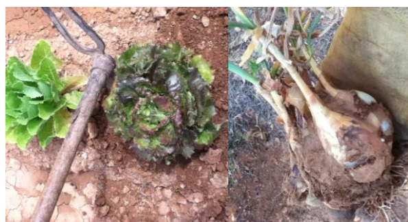
Figura 3. Recol·lecció del plantat a l'hortet

Transcorregut el temps corresponent passarem a la recol·lecció (Imatge 3) fet que els causà una gran satisfacció. Molts alumnes manifestaren que no els agradaven les verdures però que aquestes sí pensaven menjar-se-les (cosa que feren). Per les característiques de la plantació realitzada totes les plantes foren consumides quedant el terreny llest per a la utilització en els propers anys.