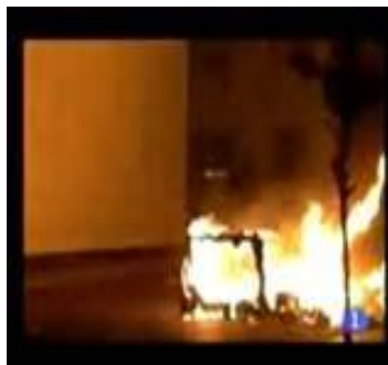
Imagen 1 – Contenedores en llamas grabados por un videoaficionado

La codificación de la unidades informativa (usamos el concepto de unidad informativa en vez del de noticia porque se ajusta más a la homogeneidad que requiere el análisis cuantitativo de la información televisiva) permite constatar cual es el caso al que se le destina más tiempo. En el 2008 el segundo al que le prestaron mayor interés todas las cadenas televisivas, fue el de la muerte de Ousmane Kote. La noche del 7 de septiembre de 2008 un joven inmigrante de origen senegalés fue asesinado en Roquetas de Mar, Almería, cuando intentó mediar en una disputa. Todas las cadenas usan la expresión “batalla campal” al darse la noticia y saltan a la palestra informativa con la imagen de un contenedor ardiendo, facilitada por un videoaficionado (imagen 1), de muy poca calidad, que dramatizan aún más el conflicto social y mostrando a la víctima con el torso desnudo en el sofá (imagen 2).