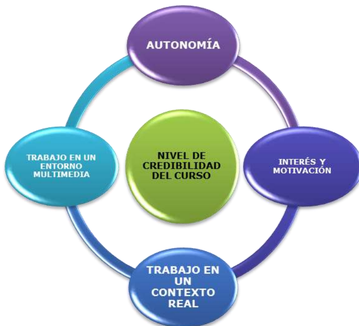
Figura1. Principales componentes del proceso de aprendizaje