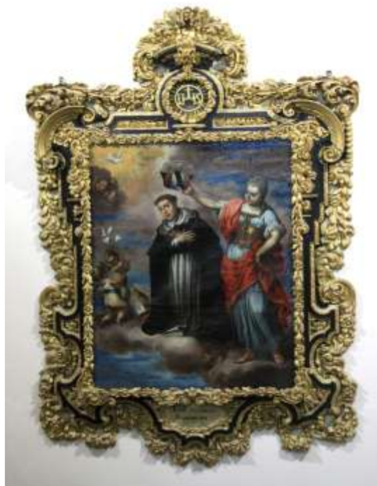
Figura 2. Coronación de Santo Tomás de Aquino

Los textos origen se seleccionaron de forma muy rigurosa. Al principio se trataba de textos que aún no eran accesibles, por lo que fue necesario llevar a cabo dos tareas de traducción. La primera fue una traducción intralingüística que consistió en la adaptación del texto en lengua española a un público ciego convirtiéndolo en texto audiodescrito, para ser locutado posteriormente; y la segunda, la traducción interlingüística hacia el alemán y el italiano. En este sentido, el encargo de traducción encomendado a los estudiantes tenía como destinatarios los turistas ciegos de lengua española, italiana y alemana. Como material docente, optamos por los siguientes textos: la fachada, el patio y la fuente de la corona, la estatua de Baco, la coronación de Santo Tomás de Aquino, el retrato de Miguel De Cervantes Saavedra , así como los cancelos de la galería inferior y los escudos heráldicos del vestíbulo . En este caso centramos nuestro estudio en La coronación de Santo Tomás de Aquino para mostrar el desarrollo de las diferentes fases en las que se dividió el encargo de traducción, tal y como se expone en el apartado anterior.