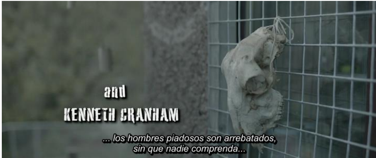
Figura 8. Captura del tiempo 0:03:58.80.

Hemos utilizado la cursiva para diferenciar distintos tipos de voz. En ocasiones eran voces ajenas que pertenecían a un televisor, pero en su mayoría son voces de personajes fuera de escena (voces en off), como en el ejemplo de la Figura 8.