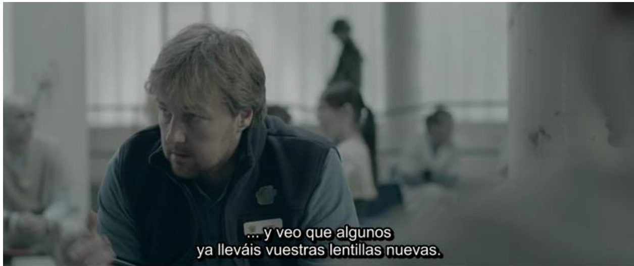
Figura 4. Captura del tiempo 0:09:04.00.