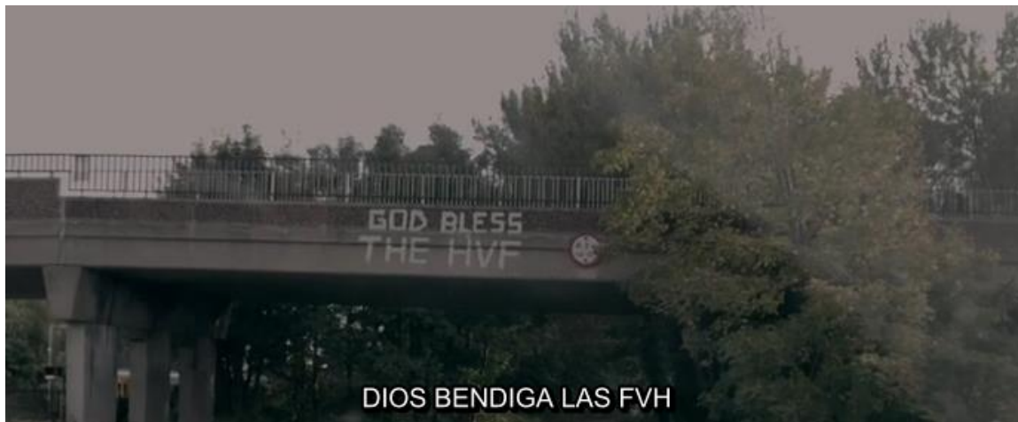
Figura 6. Captura del tiempo 0:03:41.80.

No solo nos hemos encontrado con carteles, sino con otros ejemplos de textos en pantalla. En varias ocasiones se ha tratado de graffiti urbano, por lo que hemos decidido subtitarlo siguiendo los mismos criterios que en la Figura 5: