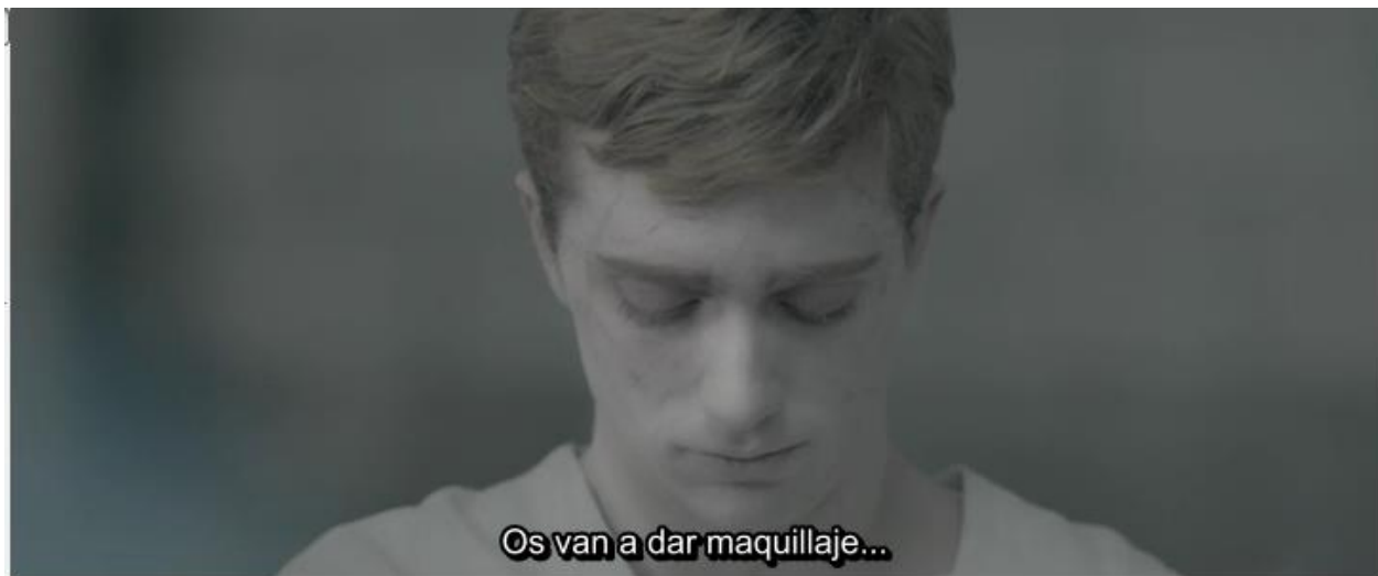
Figura 3. Captura del tiempo 0:09:01.55.

Como partir una frase en tres líneas dificultaría mucho la lectura al espectador, podemos separar frases con puntos suspensivos siguiendo las normas de Marleau (1982: 271-285). De este modo, obtenemos una lectura mucho más fluida. Hay que tener en cuenta que las frases deben dividirse por sintagmas, y no de forma aleatoria, para no desconcertar al espectador.