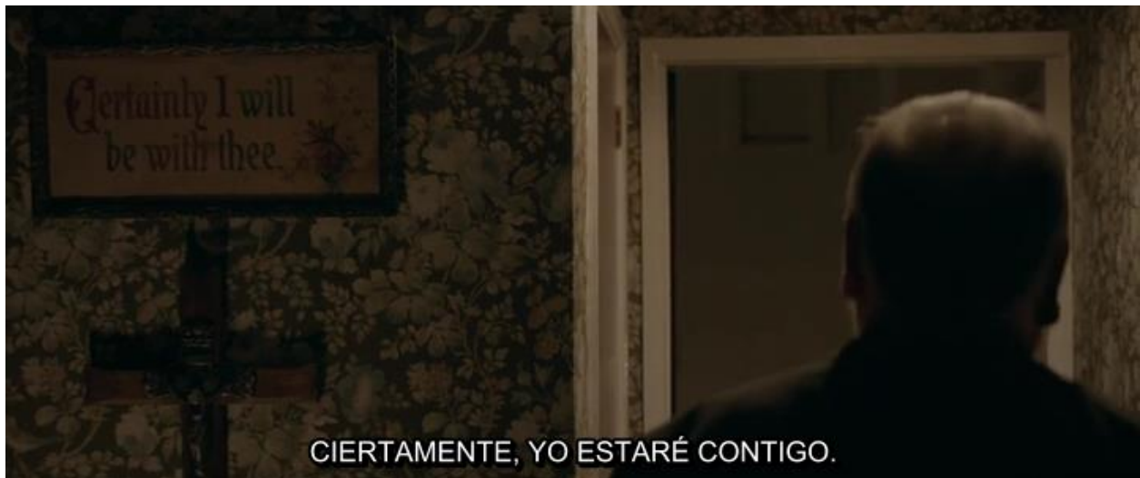
Figura 5. Captura del tiempo 0:44:35.50.

La decisión sobre si subtitular o no un texto que aparece en pantalla nos ha acarreado ciertos problemas. Tras investigar sobre las reglas y los criterios que había que seguir en estos casos, encontramos que para subtitular carteles había que emplear mayúsculas.