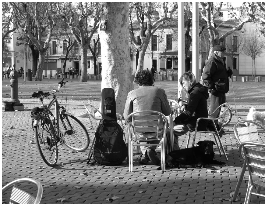
Figura 9. Terraza en la Alameda de Hércules.