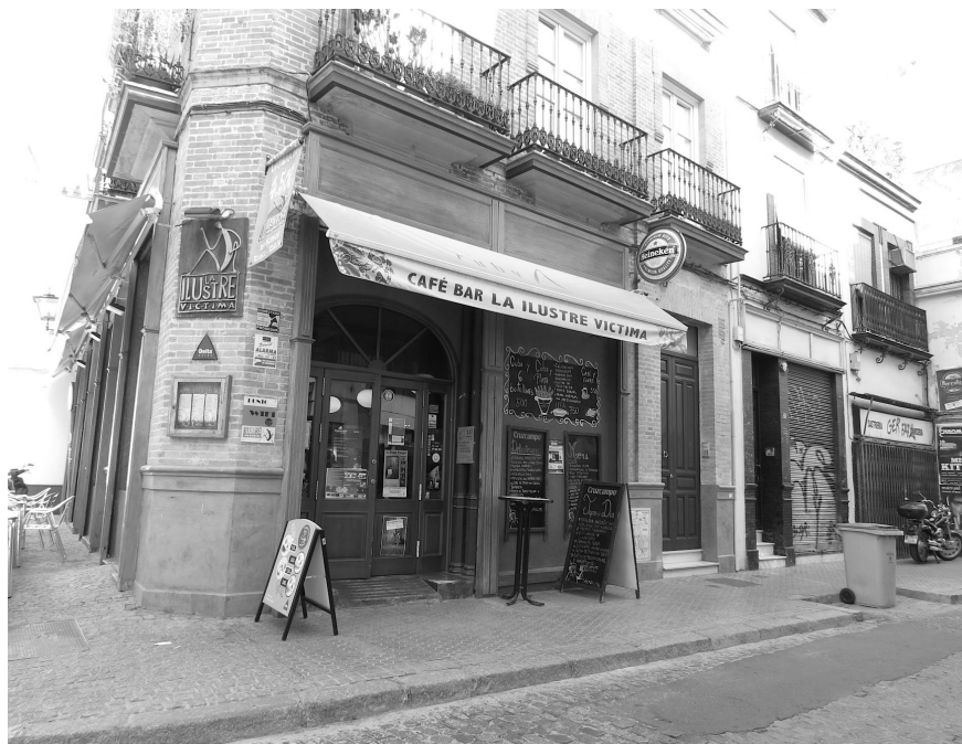
Figura 8. Vista exterior del café-bar La ilustre víctima , en la calle Correduría.