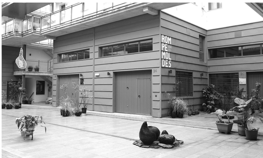
Figura 6. Patio central del edificio municipal Rompemoldes.