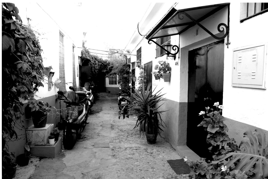
Figura 4. Calle interior del corralón de Goles.