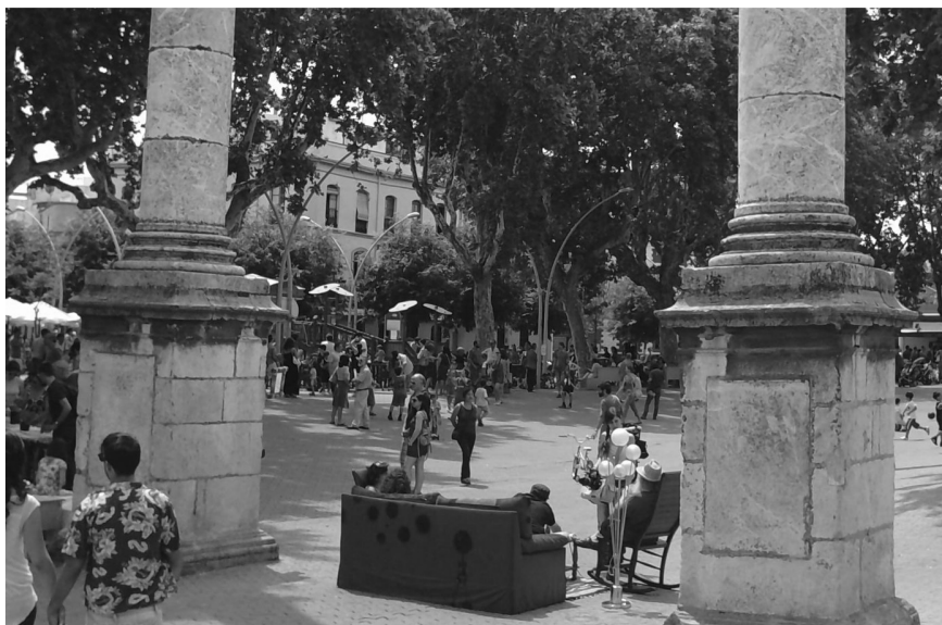
Figura 1. Acto reivindicativo en el andén central de la Alameda de Hércules —utilizando el espacio público como casa propia— frente a la propuesta construcción de un aparcamiento.