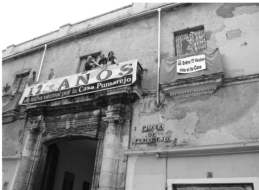
Figura 10. Fachada del palacio del Pumarejo.