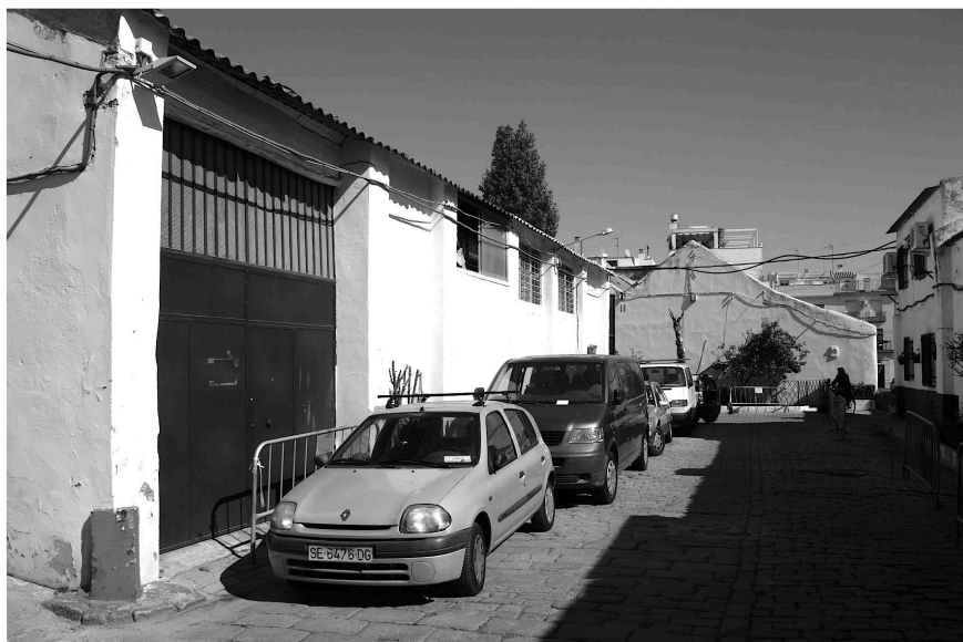
Figura 5. Calle interior del corralón de la plaza del Pelicano, 4.