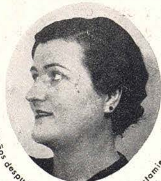
2 años después de haber terminado el tratamiento

Señora, Señorita: Su mayor enemigo El es la causa de su tristeza y preocupación: si no fuera por el VELLO que amarga su existencia, sería usted completamente feliz. Tenga LA SEGURIDAD que curará de él, acudiendo a la consulta de