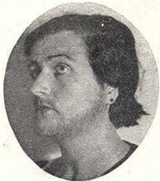
Antes del tratamiento