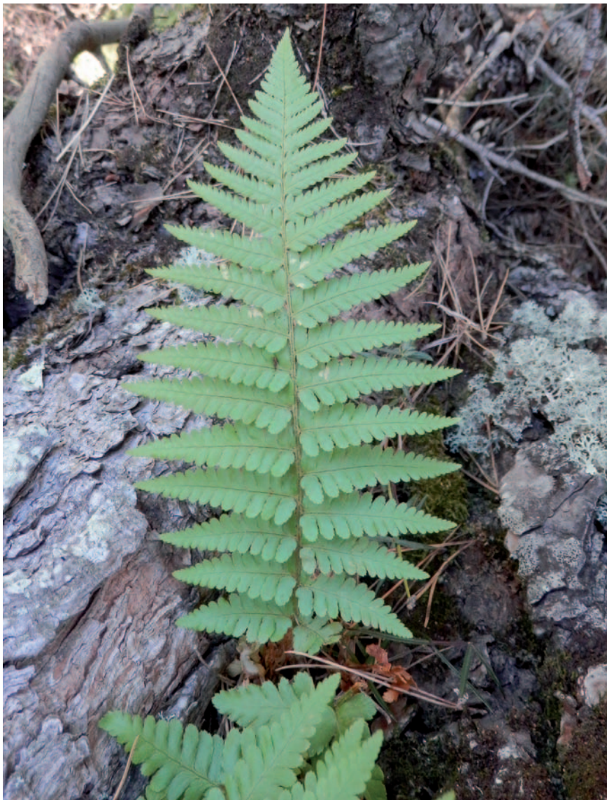
Figura 2. Exemplar de Dryopteris filix-mas del torrent de Ses Figueroles.