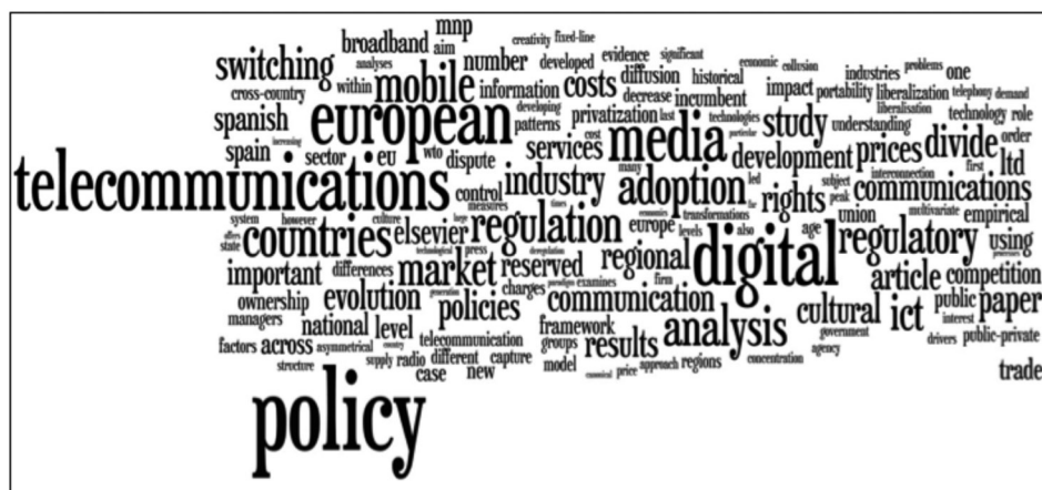
Imagen 2. Nube de etiquetas de términos en revistas internacionales