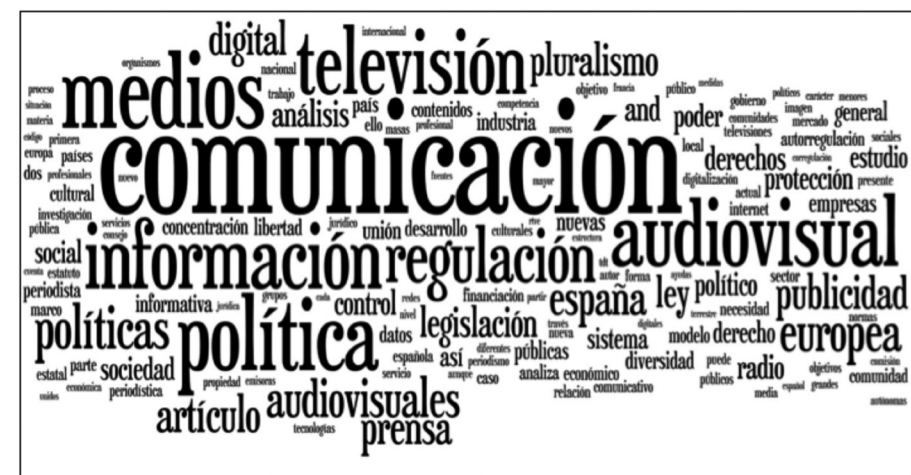
Imagen 1. Nube de etiquetas de términos en revistas internacionales

En el caso de la muestra internacional, se observa una mayor variedad (tabla 11, imagen 2). Igualmente, se repiten algunos términos como policy o telecommunications —lógico dada la importante presencia de artículos de la revista Telecommunications Policy —, pero también aparecen términos nuevos como cultural y mobile en los títulos, adoption e industry en los resúmenes, o market y divide en las palabras clave.