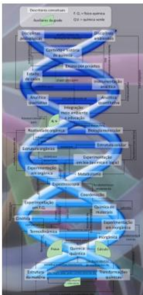
Figura 3. Mapa que mostra a área de ensino de Química fortemente relacionada à QAmb.