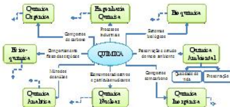
Figura 1. Fragmento de mapa construído por alunos do curso de QAL onde QAmb aparece com o mesmo status das áreas tradicionais.

Observa-se que apenas 50% dos mapas produzidos por alunos do curso BAC incluem a QAmb, comparados aos 87% daqueles produzidos por alunos dos cursos QAL. Como era de se esperar, os currículos são determinantes da maneira como os alunos concebem a QAmb. As figuras 1 e 2 apresentam exemplos de mapas.