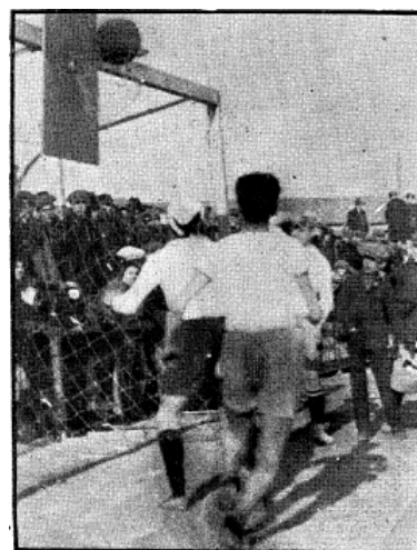
Ilustración 1: Primer partido de baloncesto.