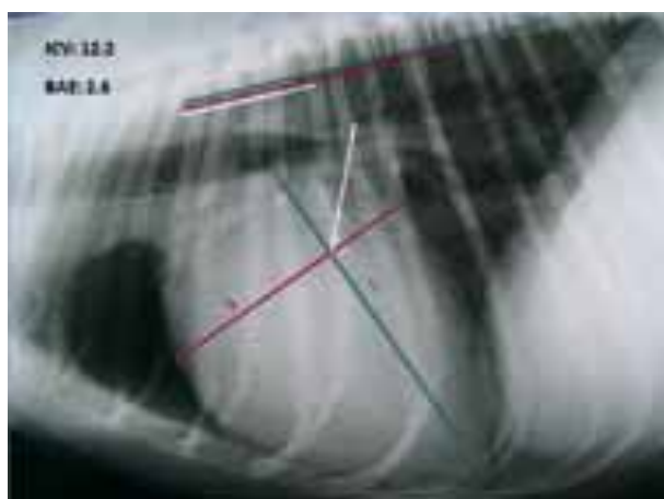
Figura 1. Radiografía lateral derecha de tórax. Representación del índice cardiaco vertebral (ICV) mediante el eje cardiaco mayor (L) y el eje cardiaco menor (S) y transposición de éstos al inicio del cuerpo vertebral de T4. Longitud vertebral del índice cardiaco vertebral: 12.2 cuerpos vertebrales. Representación de la bisectriz del atrio izquierdo (línea color blanco) y transposición de ésta al inicio del cuerpo vertebral de T4. Longitud vertebral de la BAE: 2.6 cuerpos vertebrales.

Office Powerpoint 2007) nos permite crear este ángulo de 45^\circ con respecto a la intersección de L y S. Esta medida se transpuso al inicio del cuerpo vertebral de la cuarta vértebra torácica (T4), orientada paralelamente a la columna vertebral. Se calculó entonces la longitud vertebral que ocupaba, incluyendo los discos intervertebrales (Fig.1). La magnitud del atrio izquierdo se expresó en unidades totales de longitud vertebral expresada en decimales (longitud vertebral mínima 0.1 vértebras).