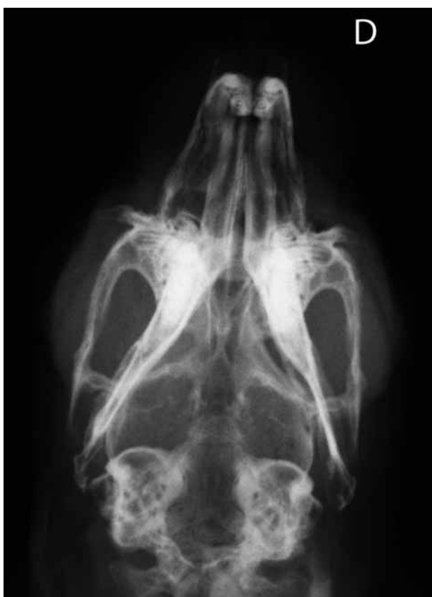
Figura 2. Radiografía ventrodorsal del cráneo, donde se evidencian las dos áreas timpánicas sin alteraciones apreciables.

10ml/kg/h a base de cristaloides (Lactato de Ringer Hartmann Braun®) con glucosa al 5% (Glucosado 5% Braun) en proporción 1:1, usando un catéter de 24Gx3/4" (Introcan® Certo) en la vena marginal auricular. La anestesia tuvo una duración de 55 minutos con ventilación espontánea bajo monitorización de la PCO 2 , de la SaO 2 , de la frecuencia cardíaca y respiratoria (MEK-Intensive Critical Care), sin incidencias.