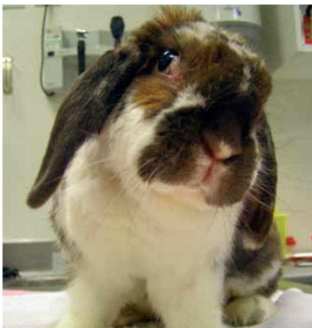
Figura 1. Imagen del paciente donde se aprecia el ladeo de la cabeza hacia el lado izquierdo.

(Fig. 1). El animal vivía en una jaula metálica con base de plástico, aunque pasaba tiempo fuera de la misma. La dieta consistía en grano comercial para conejos, heno, verduras frescas y agua “ ad libitum ”.