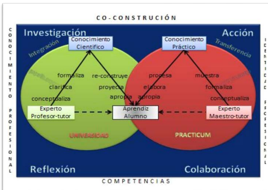
Figura 2. Escenarios de co-construcción de conocimiento e identidad profesionales (a partir de Carvalho y Tejada, 2013)

“el profesor sigue siendo un elemento clave en la mediación, pero considerado en un contextos concreto de exigencia de nuevas modalidades organizativas, posibilitadas e integradas por los medios en interacción con los alumnos como protagonistas y mediadores de su propio aprendizaje” (Tejada, 2009, p. 472).