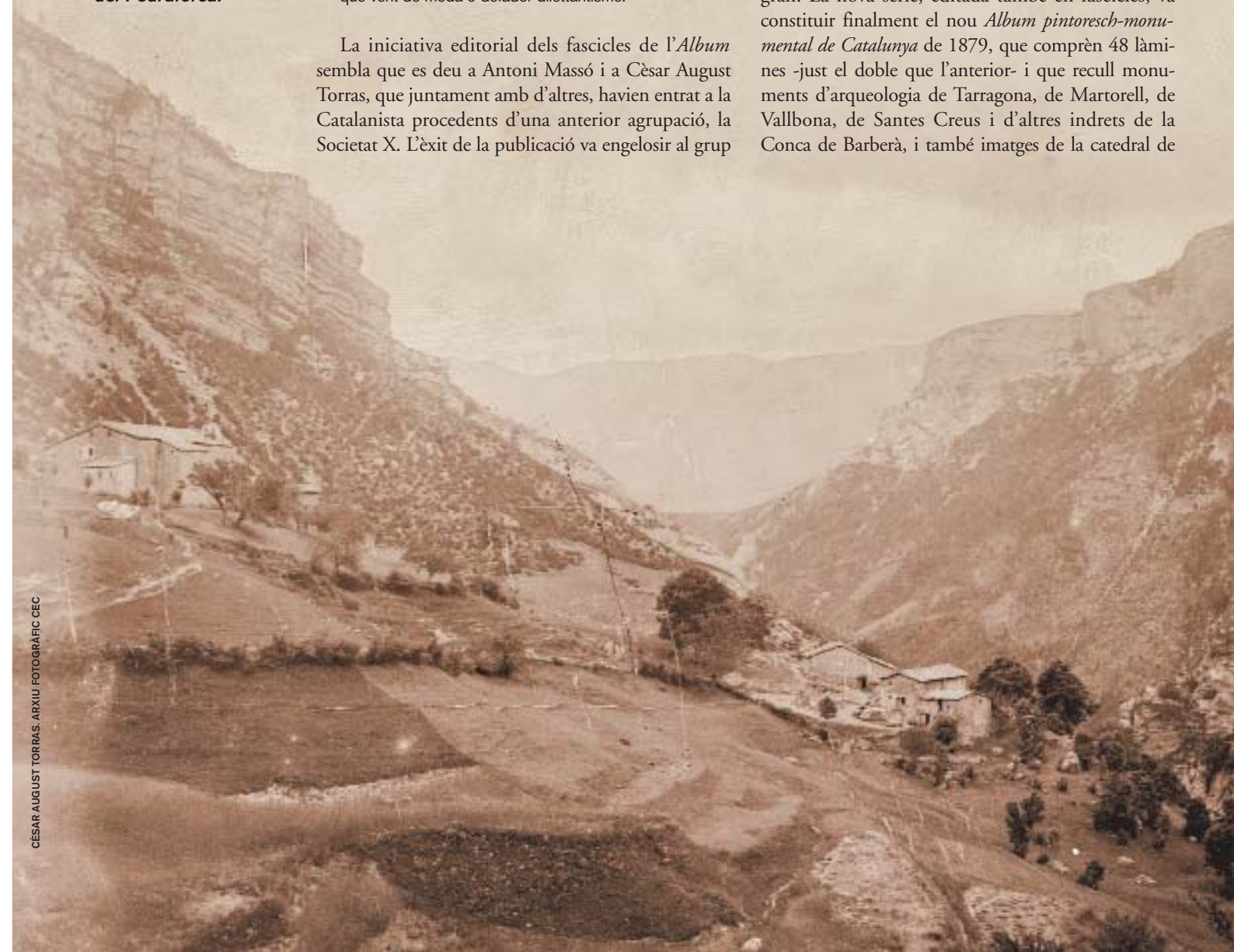
Panoràmica del santuari de Gresolet, al municipi de Saldes, situat a 1.300 m, al vessant NE del Pedraforca.