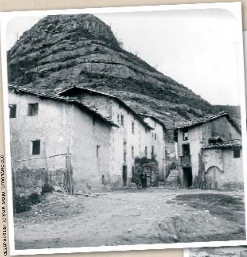
A l'esquerra, Sant Jaume de Frontanyà (Berguedà).