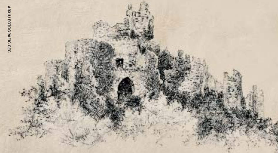
Dibuix d'Eudald Canivell.

familiaritat amb aquests materials ens pot informar del panorama monumental del país al darrer terç del segle XIX, però sobretot ens presenta la mirada, l'entusiasme i l'amor amb el què aquells homes descobrien el seu país, les restes materials del seu passat i es feien d'alguna manera apòstols de la urgència del seu redreçament material i espiritual.