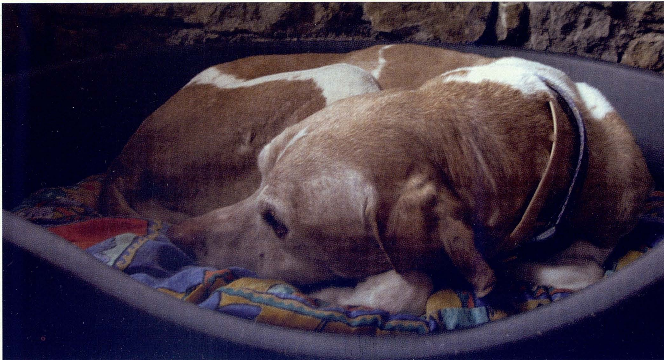
A los perros geriátricos se les debe tratar de manera especial.

hacia la particular problemática. A esto llamamos cuidados geriátricos, a partir de un momento determinado, diferente en cada individuo, pero al que ha influido un sinfín de hechos, genéticos, ambientales, etológicos, sanitarios y nutricionales, que hacen se retarde, o que se adelante. Pero siempre ocurre. Aparece alguna alteración, seguramente por un descenso de las defensas inmunológicas, por un descenso de la capacidad de recuperación y de compensación, que da lugar a otras alteraciones.