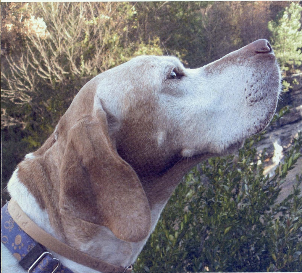
De existir signos, la alimentación deberá adecuarse al proceso para actuar como paliativo o mejorante en general.