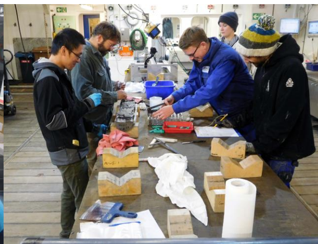
Abbildung 2: Im großen Labor des Hangars von FS MARIA S. MERIAN werden die Sedimentkerne makroskopisch analysiert und beschrieben, sowie für Porenwasser- und Gasanalyse beprobt.

Das Knipovich-Rift ist eine grabenartige Senke, die im Norden durch die Molloy Bruchzone abgeschnitten und etwa 60 km weiter westlich in der Molloy-Riftzone ihre Fortsetzung nach Norden in den Arktischen Ozean hat. Entlang eines 120 km langen Profils haben wir zunächst den Ostrand der Spreizungszone von Norden nach Süden vermessen. Der Großwetterlage hatte sich im Laufe des Tages geändert. Während wir die letzten Wochen meist Wind aus Süden oder Südwesten hatten,