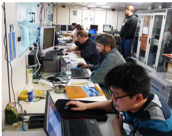
Abbildung 1: Im Hydroakustiklabor der MARIA S. MERIAN werden alle aktuellen Sonardaten des Schiffes registriert. Die Wissenschaftler können online die neuesten Daten visualisieren.