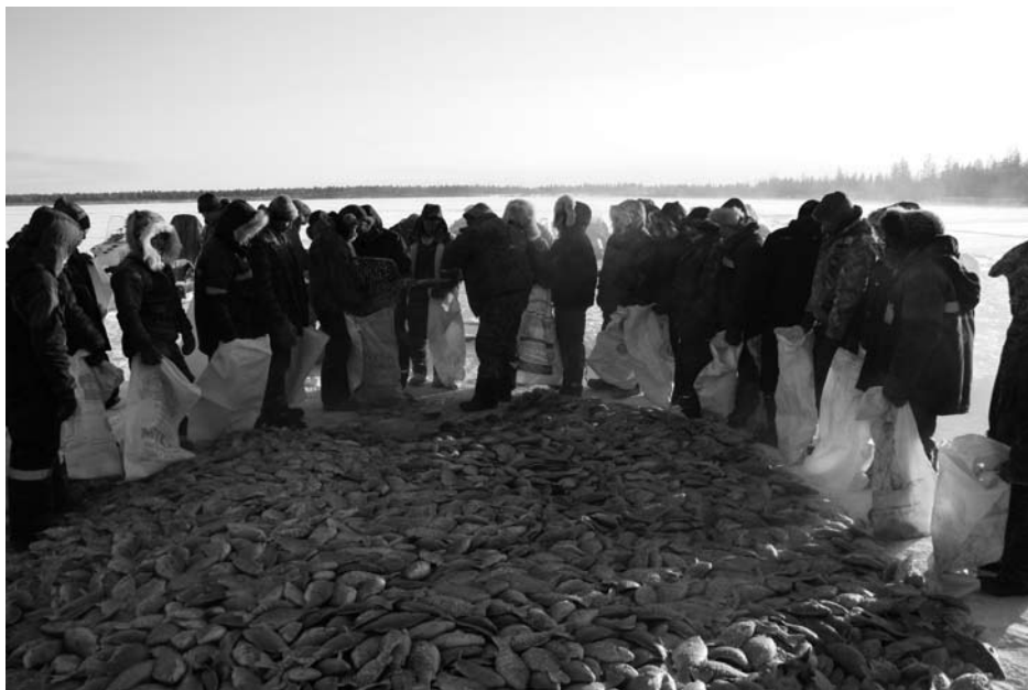
3. kép Zsákmány elosztása halászat végén

A közös húzóhálós halászatot követően a kifogott zsákmányt elosztják a résztvevők. Az első és legszebb részt a taahyyr , vagyis a gyalom szárnyait húzó halász kapja, de a többi jelenlevő (függetlenül attól, hogy ténylegesen részt vett-e a munkában, vagy sem) egyenlő részhez jut. A halat zsákokba méri ki a halászat vezetője vagy a vezető által megbízott személy. Ilyenkor a résztvevők sorban állva várják a rájuk eső egy zsáknyi porció kimérését. Amikor tiltakoztam, hogy nekem igazából nincsen szükségem egy zsák kárászra, a halászat vezetője ( brigediir ) kijelentette, hogy mindenképpen kapok én is, úgyhogy álljak csak be ugyanúgy a sorba, mint a többiek. Hogy nyomatékot adjon a szavainak, a kezembe nyomott egy zsákot is. Én is sorba álltam hát, mint mindenki más.