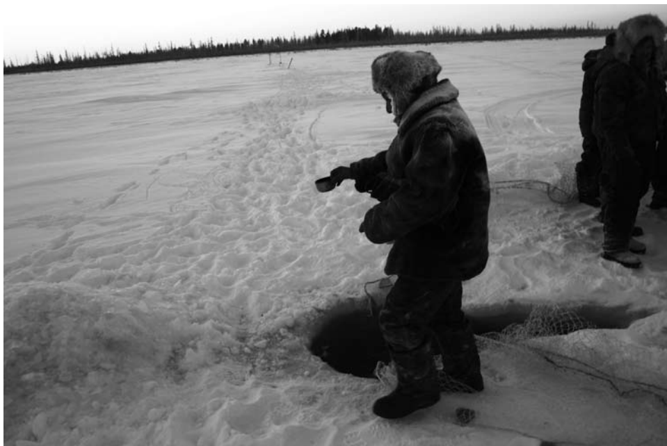
1. kép Étél kihelyezése a tó jegére

Jakutiában az emberek és a tavak kapcsolatával. Ez idő alatt több tucatnyi halászon vettem részt, amelyek során számos alkalommal láttam azt, ahogy a helyiek különféle ételeket helyeznek el a tó jegén a jég alatti húzóhálós halászat ( mungkha ) előtt vagy azt követően.