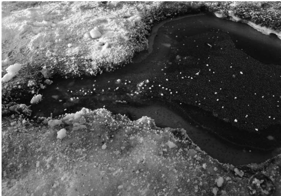
2. kép Húzóhálós halászat során ütött lék a halászat végén