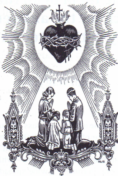
2. kép: Jézus Szíve Szövetség havi szándéka (Jézus Szíve Szövetség kiadvá- nya, 1936. május)