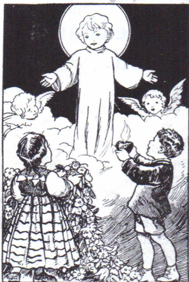
1. kép: Jézus a gyermekekkel (könyvborító: Név Nélkül: A kis Jézuska . Budapest, Korda R.T. nyomdája, 1932)