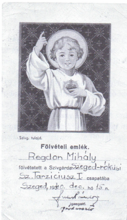
4. kép: Szivgárda Fölvételi emlék