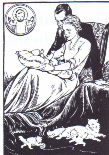
3. kép: könyvillusztrá- ció: „szentély a család...” (Csaba 1934, 111.)