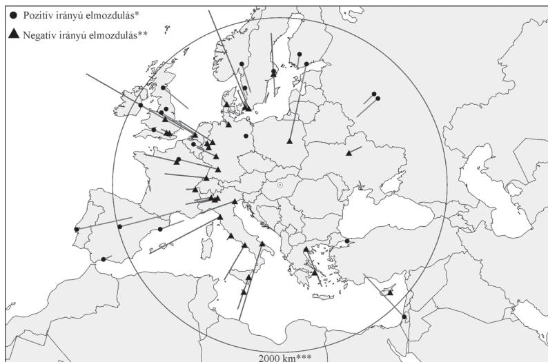
5. ábra: A Budapestről hagyományos légitársaságok járataival elérhető célállomások költségtávolság-értékei (2 hét) Cost distance of European cities from Budapest with FSNC flights (2 weeks)

Megvizsgáltuk, hogy az egyes időpontok közötti árváltozások mennyire voltak egyenletesek, azaz mekkora a korreláció az egyes időszakok között. Az eltérő célpontok miatt csak kategórián belüli összehasonlításra nyílt lehető-