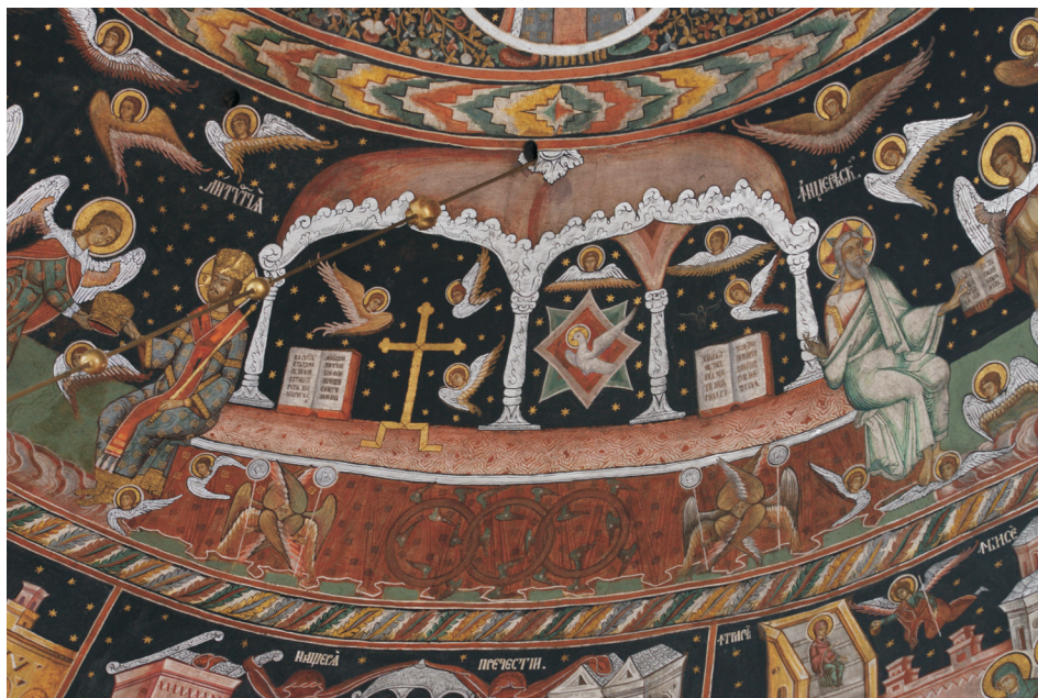
Figure 4. Liturgie divine (détail de la fresque de la coupole)