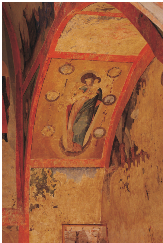
Figure 9. Vierge à l'enfant, entourée de symboles : Chapelle septentrionale de l'Eglise épiscopale Sainte Sophie de Kiev