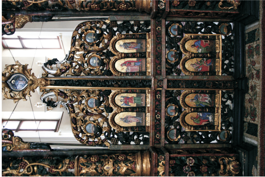
Figure 8. Porte royale de l'iconostase de l'Eglise épiscopale de Balázsfalva