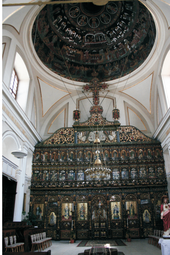
Figure 5. Iconostase de l'Église épiscopale de Balázsfalva