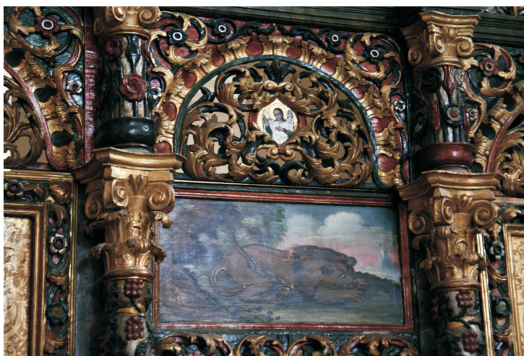
Figure 10. Le lion protecteur, sur l'iconostase de l'Eglise épiscopale de Balázsfalva