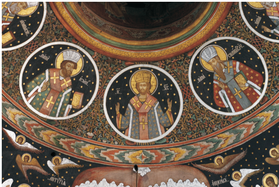
Figure 3. Le Christ en Grand prêtre, entouré de papes romains (détail de la fresque de la coupole)