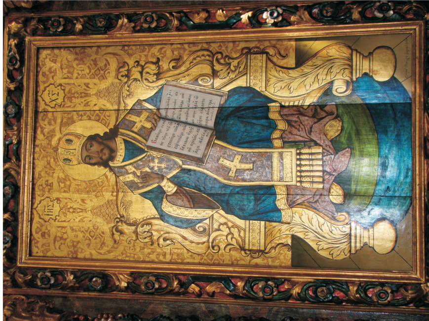
Figure 7. Le Christ en Grand Prêtre, sur l'iconostase de l'Eglise épiscopale de Balázsfalva