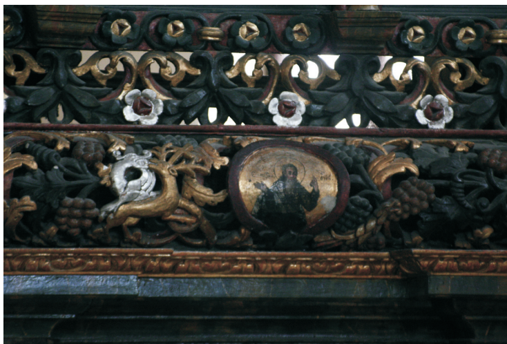
Figure 6. Cerf et dragon (détail de l'iconostase de l'Église épiscopale de Balázsfalva)