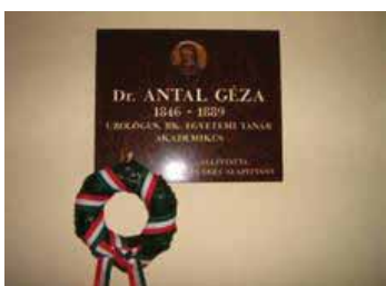
2. ábra | Antal Géza emléktáblája az Urológiai Klinikán

Antal Géza (2. ábra) 1846-ban Nagyenyeden született. Édesapja, Antal László a Bethlen-kollégium kórházának volt orvosa. Nagypja, Antal János Erdély református püspöke. Családjá 1849-ben a szabadságharc alatt elmenekült Nagyenyedről, amikor a környékére betörték a mócok (havasi románok) és igen nagy pusztítást végeztek a magyarság körében. Ennek esett áldozatul Vasvári Pál és huszárcsapata a Magyarvalkó alatti völgyekben. Az Antal család is elmenekült Nagyenyedről Marosvásárhelyre. Édesapja itt is városi orvos lett, és mint ilyen – valamint az egyházi és polgári közélet terén kifejtett buzgó tevékenysége következtében – nagy tekintélyre tett szert. Antal Géza 1865-ben lépett az orvosi pályára. A bécsi egyetem orvosi karára iratkozott be. 1870-ben Budapestre jött és itt fejezte be tanulmányait.