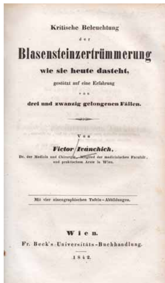
1. ábra | Ivánchich Viktor 1842-ben megjelent könyvének címlapja

A lithotripsia első klinikai fellendülése mégis Balassa János professzor nevéhez és iskolájához köthető. Az 1857-től megjelenő Orvosi Hetilap legelső, 2. és 3. számában szinte „vezércikként” jelent meg Balassa tanárnak „A húgykövekről hazánkban” című háromrészes sorozata. Az egész tanulmány a Wiener Medizinische Wochenschrift 25. és 26. számában látott napvilágot 1858-ban. Balassa végzett hólyag-hüvely-sipoly műtétet, amely ma is a nehéz műtétek közé tartozik. A hólyagszűkület kezelésével is foglalkozott, ez szintén az operatív urológia bonyolultabbjai közé sorolható. Az éternarkózt is ő vezette be Magyarországon 1847-ben. Foglalkozott a húgykövek kémiai analizisével, kőképződéssel. 1859-ben