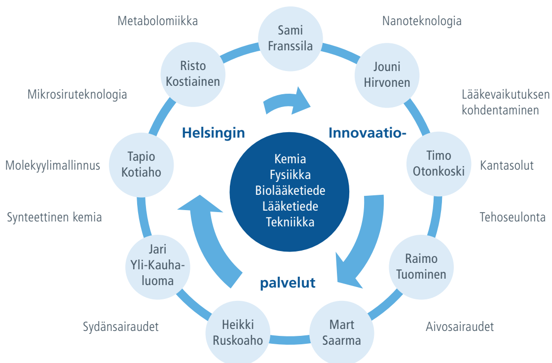
Kuvio 2. 3i-projektin tutkimusryhmät sekä tieteen ja tutkimuksen alat.

Pammolli F, ym. The productivity crisis in pharmaceutical R&D. Nat Rev Drug Disc 2011; 10: 428–38.