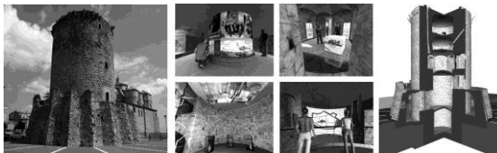
Figura 4. La Torre di San Mauro Forte: ricostruzione tridimensionale e viste degli ambienti interni

Ogni struttura ha una diversa attitudine alla trasformazione in altro da sé. Il riuso è condizionato dalle istanze conservative e dalla resistenza che l'edificio mostra verso la sua trasformazione. Questa resistenza è legata alla tipologia architettonica ma anche alla nuova funzione che si vuole attribuire. Le soluzioni oscillano tra l'intento di non alterare il valore storico e l'esigenza di soddisfare i requisiti di sicurezza, in vista di una riutilizzazione. Inoltre, la tutela risulta efficace se connessa al recupero dell'opera, che può avvenire attraverso finalità nuove, ma sempre in armonia con le caratteristiche che danno significato al monumento stesso. In linea con queste indicazioni generali, il progetto illustrato propone il riuso della Torre di San Mauro Forte (Basilicata, Mt), unico elemento conservato del castello normanno-svevo. La torre cilindrica ha una struttura plano-altimetrica complessa concepita per esercitare un'efficace azione di difesa e controffensiva.