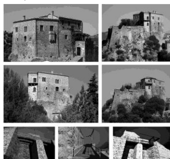
Figura 3. Il Castello di Valsinni prima e dopo l'intervento. Ricostruzione del ponte levatoio

In tale approccio, il progetto di conservazione, di consolidamento e di architettura si pongono in un rapporto di collaborazione ed armonizzazione. La progettazione è rivolta a ripristinare la sicurezza strutturale, rinforzare le strutture che mostrano indebolimento e cedimento e preservare la qualità architettonica degli elementi. Inoltre, poiché la scelta di potenziamento statico e strutturale deve essere intesa come salvaguardia dell'ossatura portante, come premessa per garantire un'adeguata fruibilità e sicurezza, è possibile affermare che tale intento non è lontano da quello conservativo ma, al contrario, si connette armoniosamente ad esso. Il miglioramento strutturale diventa parte integrante del progetto costituito da azioni di conservazione, recupero e consolidamento statico, orientato a rafforzare gli elementi interessati da dissesti, nel rispetto delle tipologie costruttive tradizionali, anche al fine di non generare un'alterazione dell'equilibrio statico e strutturale della struttura complessiva.