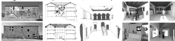
Figura 2. Il Castello di Calvello, facciata nord prima e dopo l'intervento di restauro. Restauro del cortile e ricostruzioni tridimensionali degli ambienti interni

luce, la linea progettuale prescelta è stata quella di mantenere un effetto unitario, così che fosse percepibile l'immagine originaria. L'allestimento museale ha consentito la riapertura al pubblico degli spazi del castello, con un percorso che permette di visitare tutti gli ambienti, collegando i diversi spazi museali, di cui si è ipotizzato un riordino.