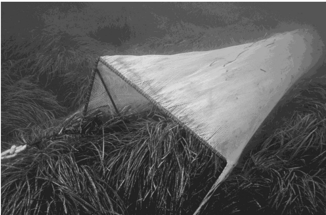
Fig 2 - Il gangamo in azione sulla prateria a Posidonia oceanica