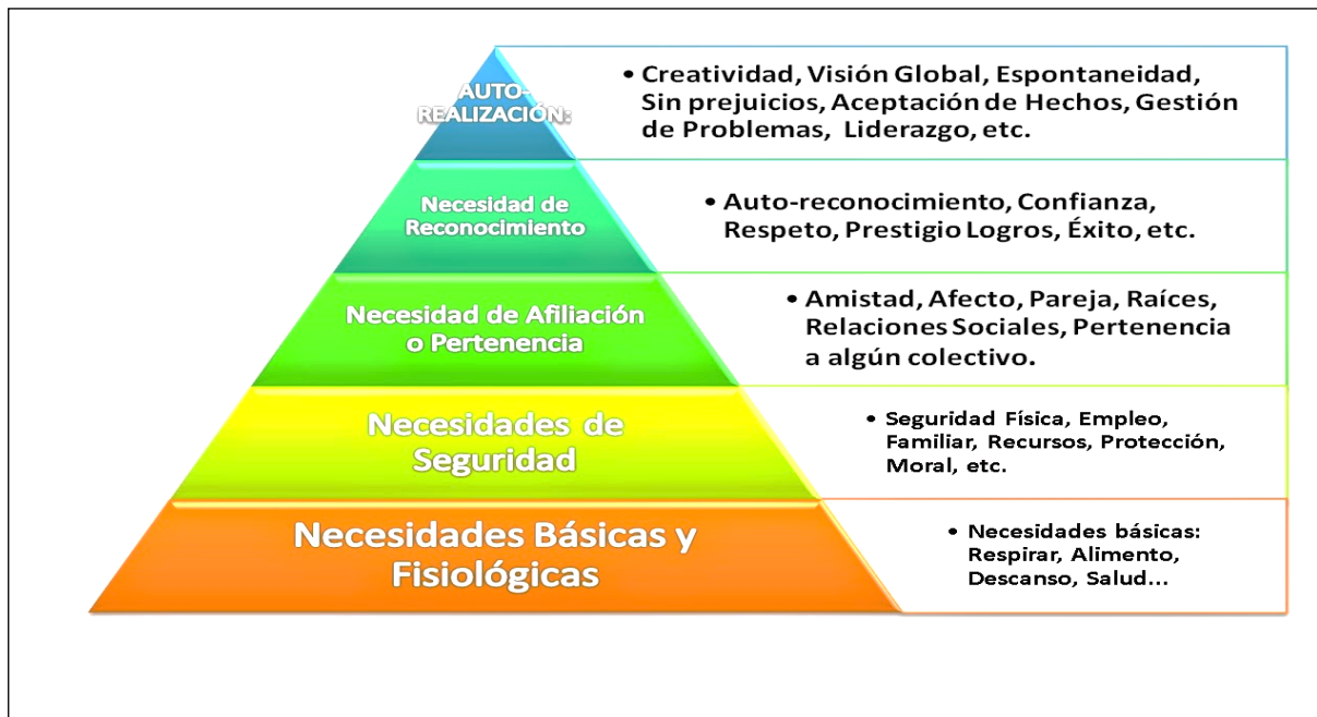
Ilustración 1 Piramide de Maslow