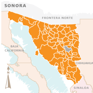
Fig.1 Ubicación de San Pedro de la Cueva en Sonora Fuente: SE Sonora (2012)

estratégico para incorporarse al sistema generador de microeconomías al interior del estado, como los municipio localizados en la frontera norte, o centro industrial del estado, de no ser así las capacidades endógenas de la comunidad podrán ser carentes e insuficientes a la demanda y diversificación socio-productiva que su vocación productiva y turística posee. Por lo tanto es necesario en la visión estratégica que platen los actores sociales, económicos y políticos del municipio, consideren una integración se potencialidades sectoriales, que permitan en mediano y largo plazo fortalecer las capacidades existentes en el municipio, así como integrar otras áreas desfavorecidas por recursos financieros, técnicos y de interacción institucional.