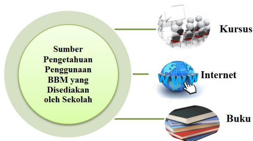
Rajah 2: Pola Dapatan Kajian bagi Sumber Pengetahuan GPI semasa Penggunaan BBM.

Sumber buku pula diwakili oleh GPI di SA, SB, dan SC. Buku yang digunakan oleh GPI adalah disediakan di sekolah untuk menambah pengetahuan tentang penggunaan BBM (GPISA, 2012: 348). Pengetahuan GPI diperolehi melalui pembacaan buku-buku yang berkaitan dengan aplikasi pelbagai jenis BBM yang sekolah perolehi dari pasaran (PYSB, 2012: 172; GPISB, 2012: 674; GPISC, 2012: 376). Secara keseluruhannya, amalan penggunaan yang mencapai tahap pola dapatan kajian ini ditunjukkan pada Rajah 2.