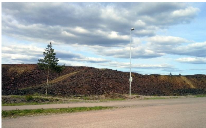
Figur 1. Högar av slagg/varp i centrala Falun 2016. Foto Stina Jansson, maj 2016.

Slagg har använts som fyllnadsmassor vid vägbyggen och under västra delen av staden längs Faluån upp mot gruvan ligger bebyggelsen på ett par meter tjockt slagglager (Sandberg 1996). Från 1960-talet och framåt har flera projekt och utredningar kring metallläckage från gruvavfallet och hur det ska hanteras gjorts, i syfte att minska utlakning till vattendrag (i förlängningen för att minska Östersjöns metallbelastning) och att minska halterna av metallstoft i luften (Christiansson, Elert & Jones 1998; Hanaeus 2010). Se figur 3 för lokalisering av gruvavfall i Falun.