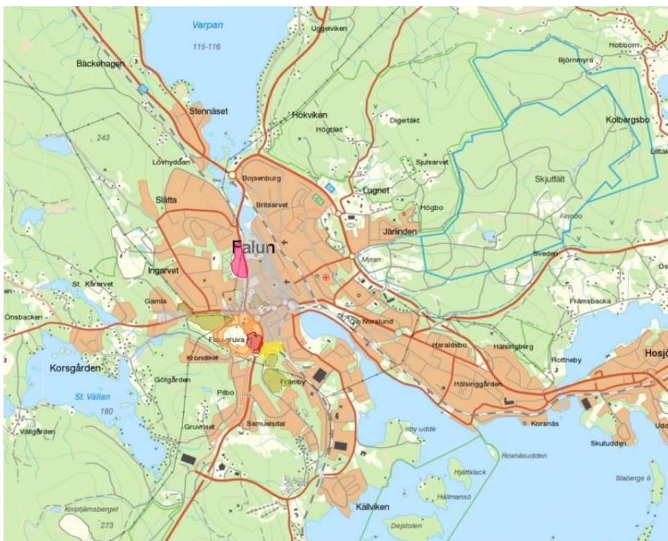
Figur 3. Lokalisering av gruvavfall i Falun. Färgmarkeringar runt Falu gruva innebär avfall av olika typer.

Den litteratur som har använts är i huvudsak vetenskapliga artiklar, men också myndighetsrapporter, tryckta verk, uppslagsverk, information på webbsidor och ett examensarbete. Markkemi och växtfysiologi är ämnen som det har forskats inom länge, varför användbar information finns att hämta även i litteratur som inte är av senaste datum.