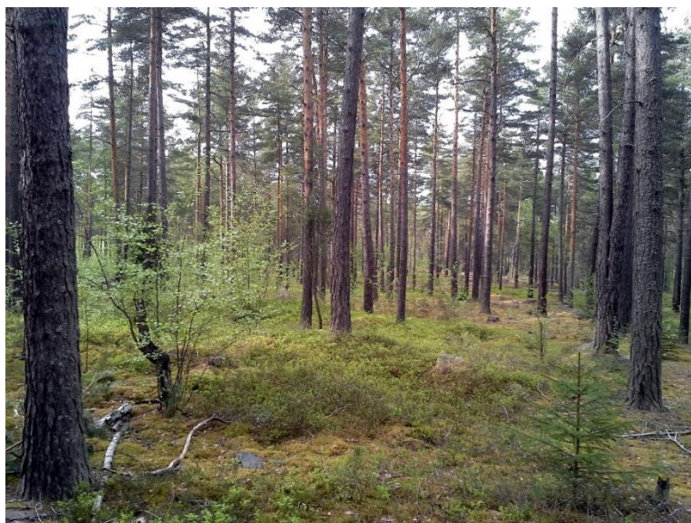
Figur 7. Tallskog med rikare undervegetation på Galgberget. Foto Stina Jansson, maj 2016.