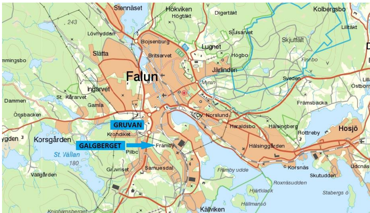
Figur 5. Området Galgbergets lokalisering i förhållande till gruvan. ©Lantmäteriet 2016. Kartan är modifierad.

Asensio, Covelo och Kandeler (2013) har i försök med trädplantering av tall ( Pinus sp. ) och eukalyptus ( Eucalyptus sp. ) och jordförbättring med rötslam på före detta gruvmark funnit att både markens pH-värde och näringsämnenas tillgänglighet ökade med båda metoderna. Enbart trädplantering ökade inte mikrolivet i marken, men en kombination av trädplantering och rötslam ökade markant den mikrobiologiska massan. Trots det ökade mikrolivet och tillgången på näringsämnen vid tillförsel av rötslam kunde metallernas negativa inverkan spåras.