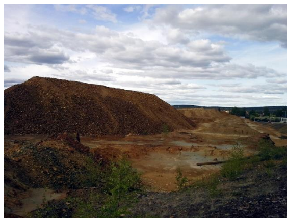
Figur 2. Rödfärgsråvara på gruvområdet 2016. Foto Stina Jansson, maj 2016.