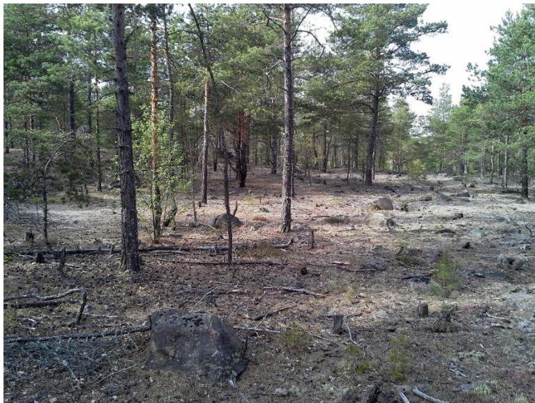
Figur 6. Tallskog på Galgberget 2016. Avsaknad av undervegetation och låg nedbrytning av förna. Foto Stina Jansson, maj 2016.

Eftersom näringsupptaget generellt är känsligt för förändringar i pH är det rimligt att anta att näringsbrist är det störst hotet mot vegetation som växer på försurad mark. Lågt pH gör också att upptaget av de flesta metaller ökar och med dålig näringsstatus skulle vegetationen kunna vara mer sårbar för fytotoxiska effekter. För att förbättra näringstillgången och minska upptaget av metaller kan jordförbättrande metoder användas. I sur skogsmark har kalkning visat sig öka nedbrytningen av förna och nybildandet av humus och därmed öka näringstillgången för tall. Kalkning kan också kombineras med tillförsel av organiskt material och rötslam, i jordförbättrande syfte.