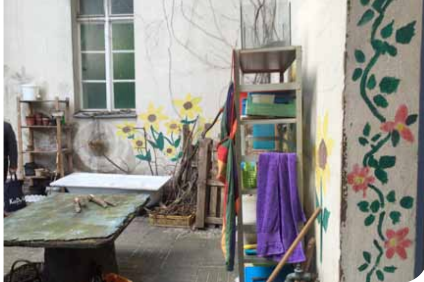
Afbeelding 4 en 5. Erika-Mann-Grundschule: Een 'drakentron' in de stille ruimte en een 'verloren' hoekje voor vrij spel.

ven' kregen in het klaslokaal. In heel wat gevallen gaat het over voorwerpen geschonken door ouders van leerlingen, collega's of bureaus van de leerkracht. In nog andere gevallen ging het over zaken die thuis bij de leerkracht hun nut verloren hadden, en dus op zolder of zelfs het containerpark dreigden te belanden. Een oud bankstel, een reeks afgedankte bedrijfskasten, een bureautje, een dia-projectiescherm, oude kleren, knuffelberen, zandtafel of een schommelstoel ... Noem het maar op. Uit getuigenissen bleek dat de leerlingen zeer aangetrokken werden door deze 'speciale' objecten en dat de leerkrachten gehecht waren aan deze voorwerpen, wellicht door hun investering hierin. Een andere categorie die toegevoegd kan worden aan de collage, zijn zaken uit de private sfeer die verwijzen naar het (familie)leven van de leerkracht buiten de klas, zoals familiefoto's en/of knutselwerkjes van de eigen kinderen. Het is bijzonder om te zien hoe deze laatste als het ware materieel opgaan tussen de tentoongestelde werkjes van de leerlingen en hoe op die manier de grenzen tussen familie- en klasleven symbolisch vervagen. En een laatste en misschien wel de belangrijkste categorie, zijn de voorwerpen die de eigenheid en sterktes van de leerkracht etaleren