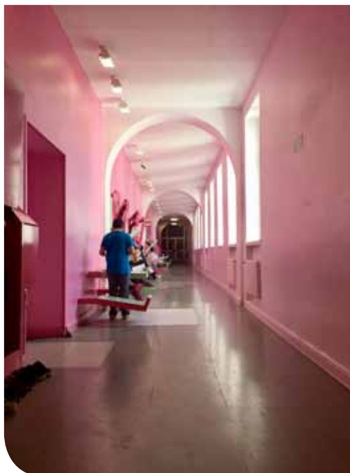
Afbeelding 2 en 3. Erika-Mann-Grundschule: Leerlingen aan het werk aan de opklapbare werktafels en de 'drakeneieren' in de lang wandelgangen.

Klassen mogen dan al een universeel karakter hebben, toch reflecteren ze in hun materialiteit en organisatie ook de persoonlijkheid van de leerkracht. Naast het gestandaardiseerde meubilair en gecommmercialiseerde didactische materialen, duiken er heel wat voorwerpen op die de klas een persoonlijk karakter geven. Zo verschijnen er frequent objecten die een 'tweede le-