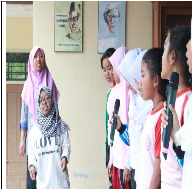
Latihan nyanyi buat perpisahan ppl