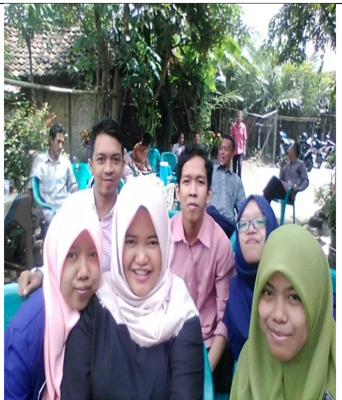
Acara Darmawanita SMPN 2 Cangkringan