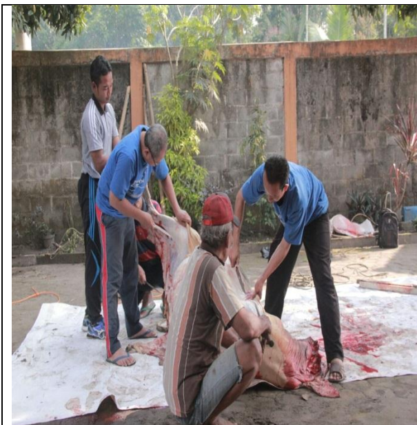
Menguliti sapi yang telah disembelih bersama bapak guru