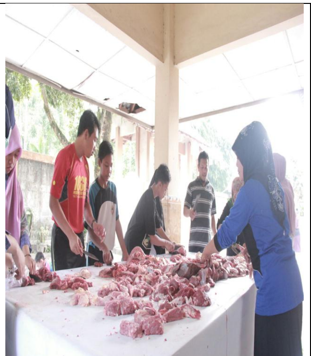
Perayaan Idul Adha di Sekolah