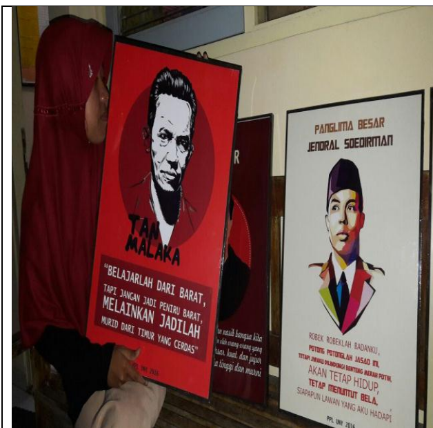
Pemasangan Quote sebagai tanda kenang-kenangan dari mahasiswa PPL