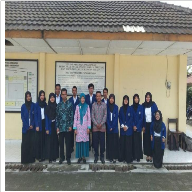
Penyerahan PPL UNY