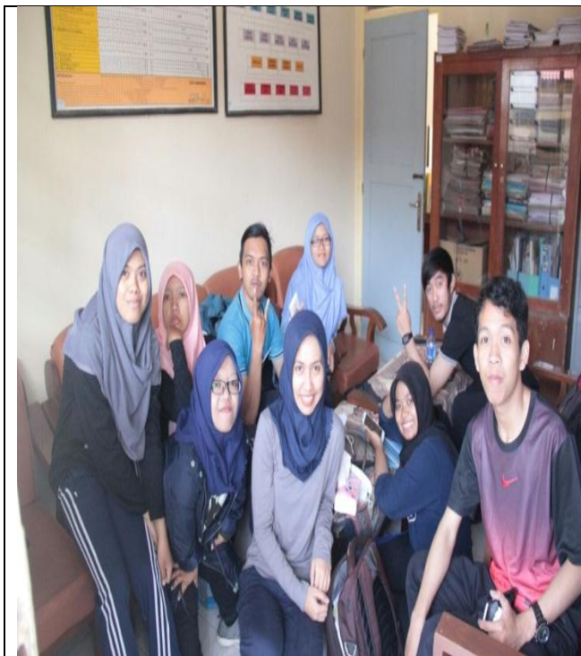
Istirahat setelah kerja bakti