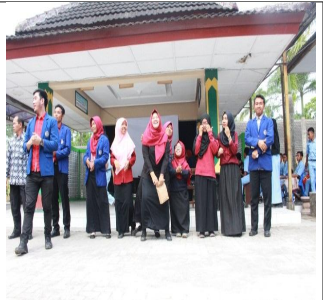
Acara perpisahan ppl