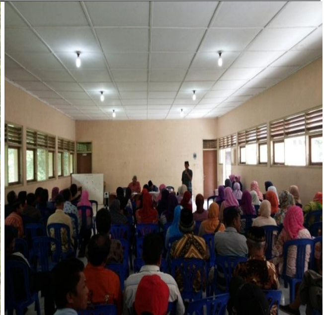
Pertemuan dengan orang tua terkait dengan lomba sekolah sehat