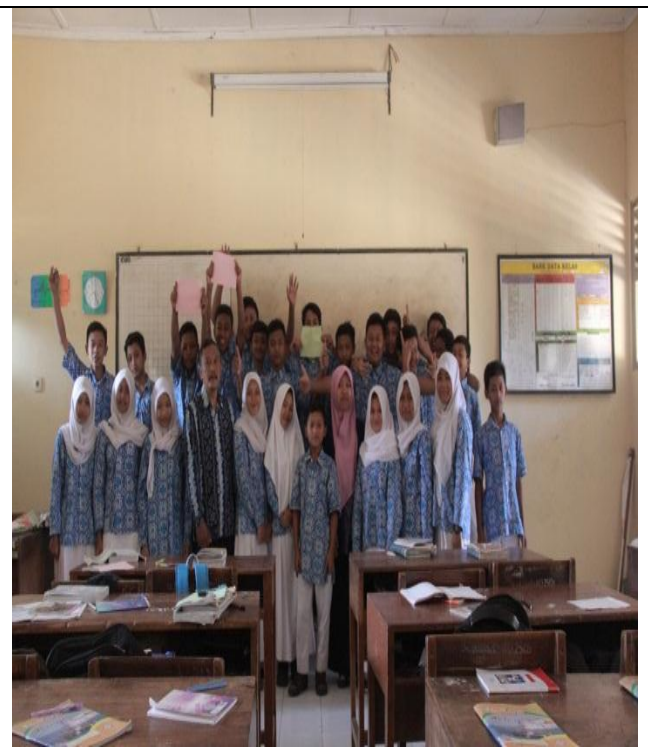
Mengajar IPS di kelas VIIIA