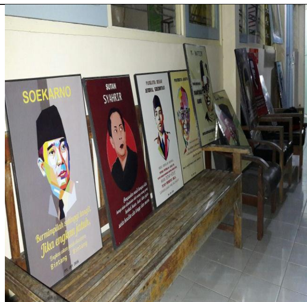
Quote yang akan dipasang di sekolah