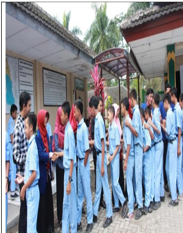
Suasana perpisahan ppl