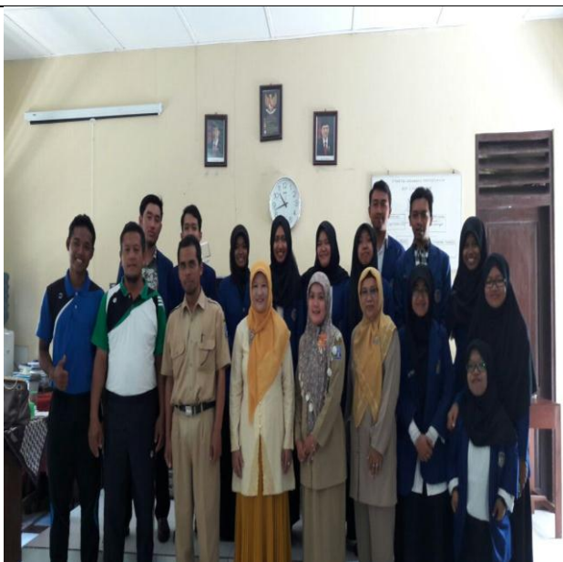
Foto pasca penarikan PPL