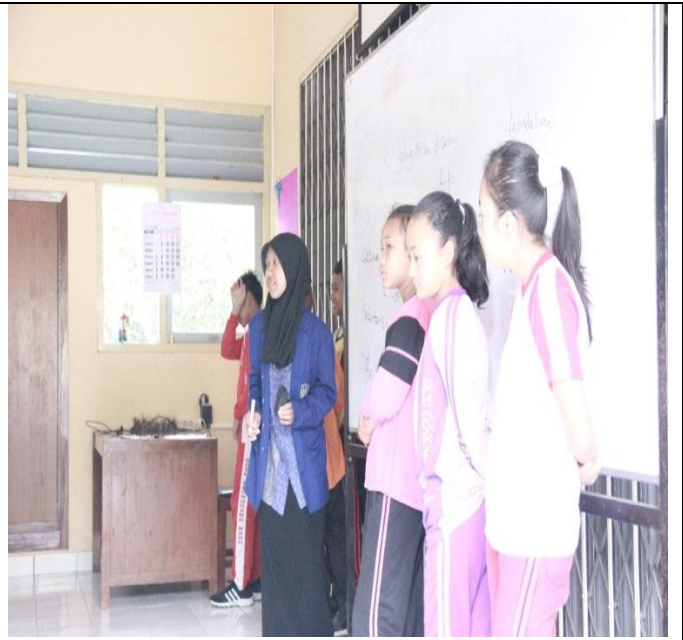
Membantu pemilihan pengurus kelas VIIB