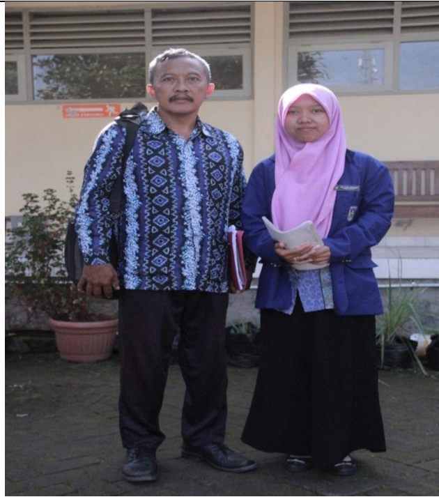
Foto bersama Guru Pembimbing di sekolah