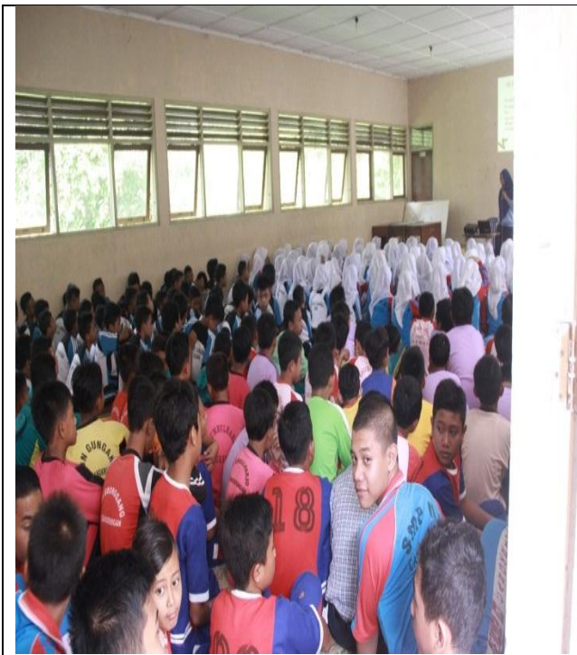
Acara Sosialisasi Kenakalan Remaja