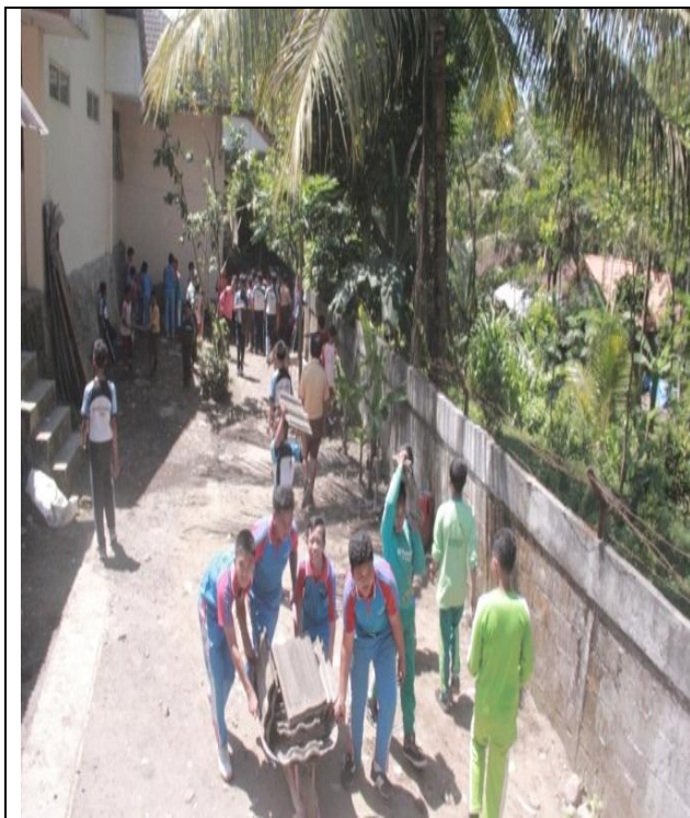
Kerja bakti membersihkan sekolah