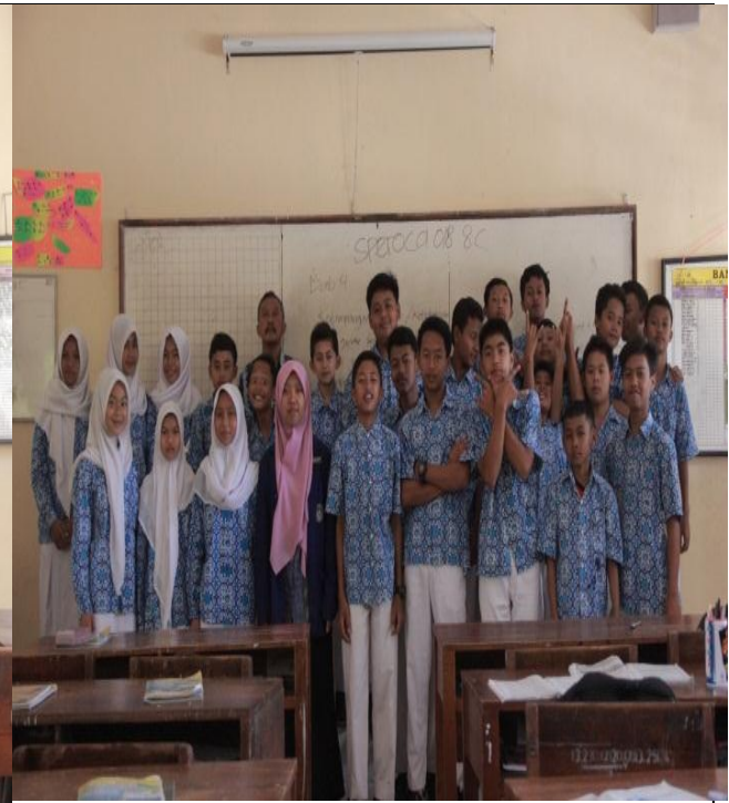
Mengajar di kelas VIII C