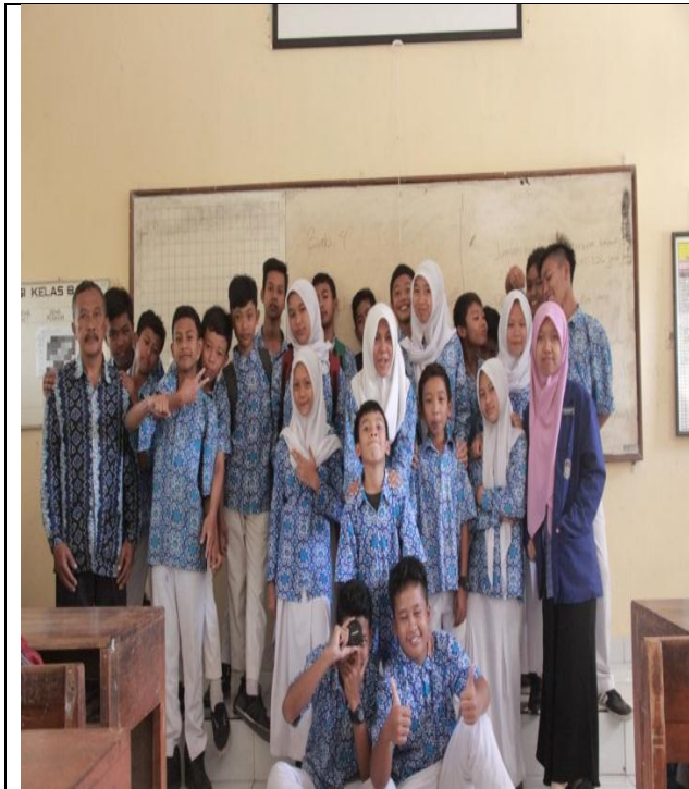
Mengajar di kelas VIII B