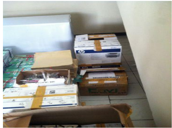
Pengelolaan persiapan kurikulum (ATK & LK)