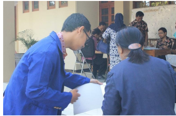
Diklat Kurikulum 2013 bagi kepala sekolah