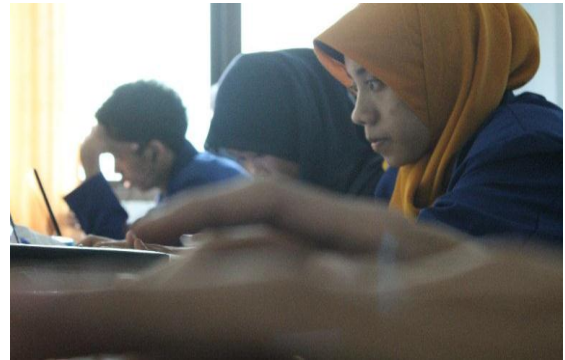
Pengelolaan Database kurikulum2013