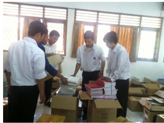
Pengelolaan administrasi kurikulum