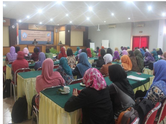
Diklat kurikulum 2013