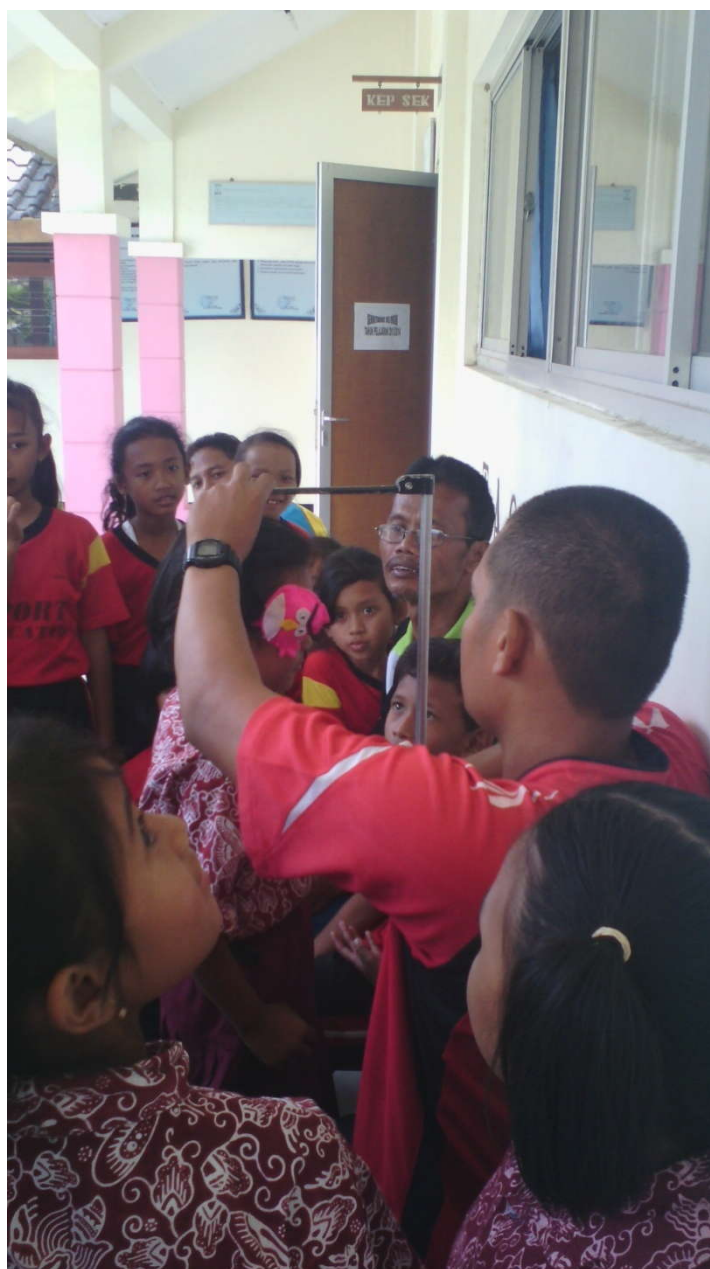
Penimbangan BB dan TB kelas I sampai kelas VI