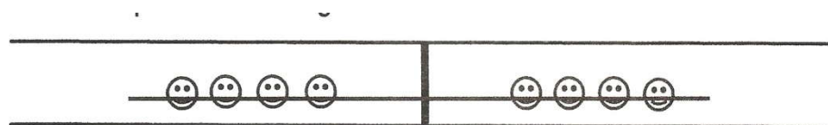
Gambar Arena Bermain Permainan Kutub Magnet Terkuat