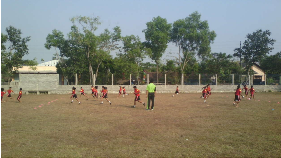
Pembelajaran Kelas IV