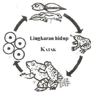
Gambar Daur Hidup Katak

Media/Alat Bantu dan Sumber Belajar : Gambar daur hidup katak, bola jenis 1 buah, dan bubuk kapur