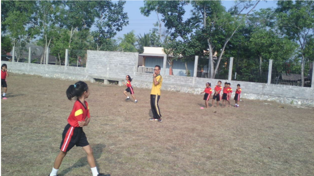
Pembelajaran Kelas III