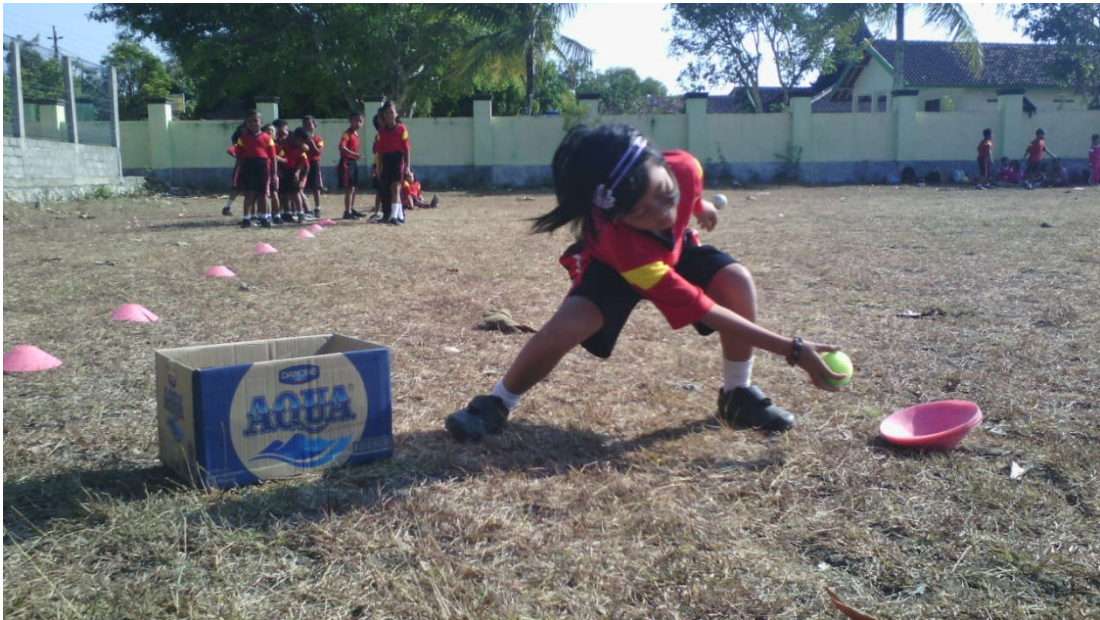
Pembelajaran Kelas II