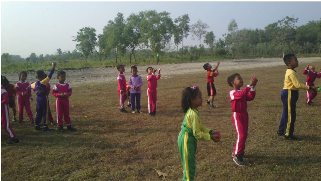
Pembelajaran Kelas I