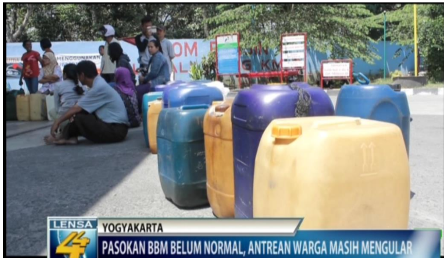
SCREEN SHOOT VIDEO TEASER