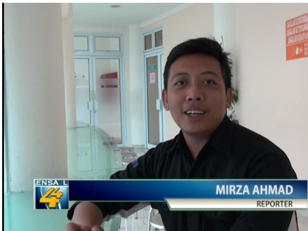
SCREEN SHOOT NEWS LENS 44 TAYANG