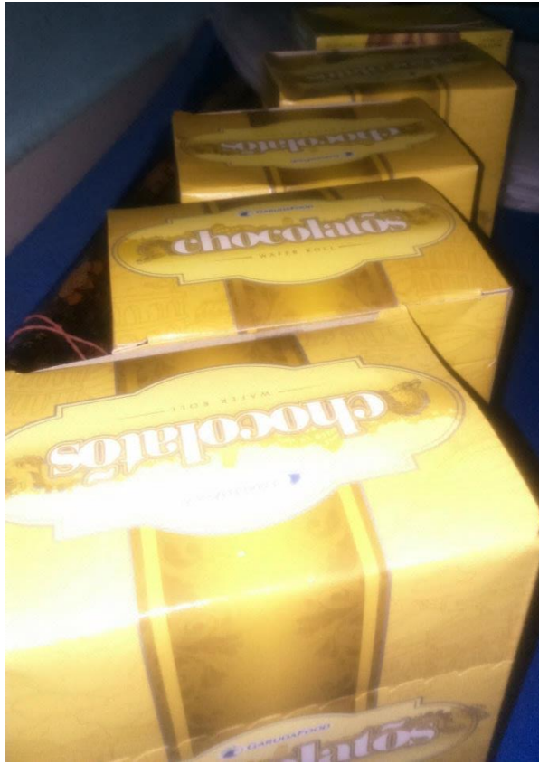
Mempersiapkan Kenang-Kenangan untuk Siswa yang Meraih Nila Tertinggi Kos / Senin, 1 September 2014 / 18.30 WIB