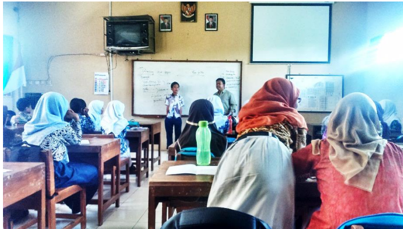
Observasi Pembelajaran di Kelas 7A Ruang Kelas 7A / Jumat, 8 Agustus 2014 / 11.20 WIB