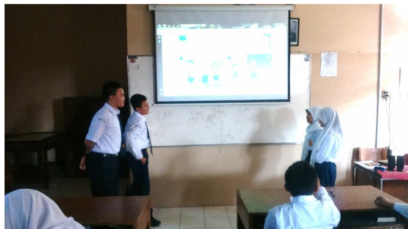
Mengajar Greeting di 7B Ruang Kelas 7B / Kamis, 14 Agustus 2014 / 08.10 WIB