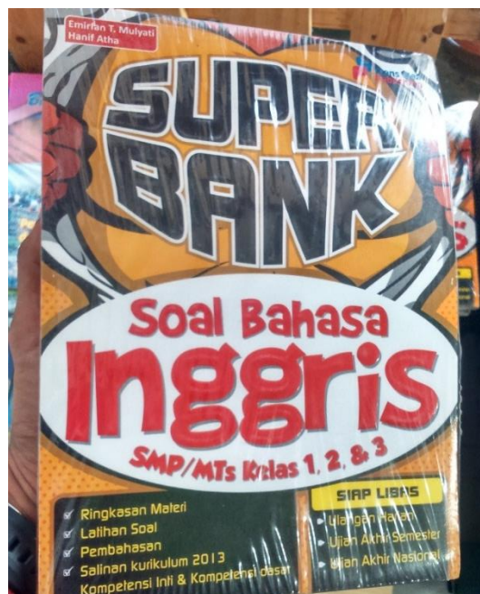
Survei Program PPL Individu Pengadaan Buku Toko Buku Togamas Suroto / Minggu, 10 Agustus 2014 / 11.53 WIB