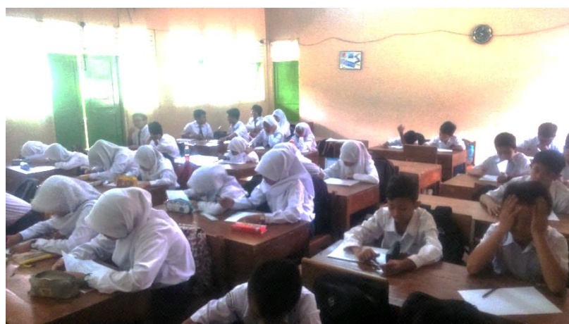
Pelaksanaan Ulangan Harian di 7C Ruang Kelas 7C / Selasa, 26 Agustus 2014 / 07.40 WIB