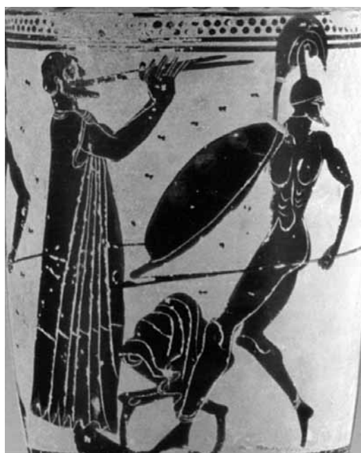
6. Particolare di lekythos con suonatore di aulos e guerriero nell'atto della danza armata (Museo Archeologico Nazionale di Taranto, inv. 4573).

Mentre l'artista sta esibendosi 43 , all'improvviso tutti gli spettatori, a eccezione del sordo, lo lasciano perdere perché è suonata la campana che annuncia il ritorno delle barche da pesca; ma quando il suonatore, nel ringraziarlo per il suo amore verso la musica, lo avverte del motivo dell'esodo degli altri, il sordo gli ricambia il ringraziamento e a sua volta lo lascia con un palmo di naso 44 .