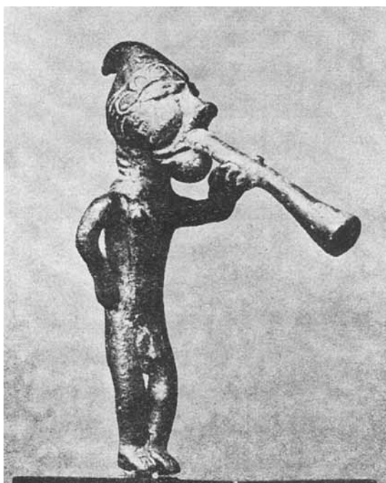
5. Suonatore di tromba da Mylasa (da Hanfmann 1962, tav. 3, fig. 7).

cappuccio riccamente ricamato terminante a punta e ha guance gonfie nell'atto di insufflare con forza nella tromba che egli regge con la mano sinistra dalla parte inferiore del tubo (nell'atto di suonare la nota fondamentale della canna?) 29 . Lo strumento musicale era usato non solo nell'ambito dei riti e delle cerimonie religiose, ma anche negli spazi ampi per richiamare la folla 30 o per dare segnali sonori nel corso della battaglia 31 .