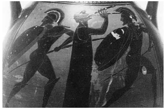
1. Danza armata: suonatore di aulos a canne doppie tra guerrieri con lance e scudi (da Panvini 1998, p. 392, fig. VIII.47)

Nel corso degli ultimi anni, nell'ambito degli studi musicologici riguardanti il mondo antico, è stato riscoperto il legame fra il contesto geografico e le tradizioni musicali regionali con i loro particolari elementi connessi alla identità culturale delle varie comunità. Di queste caratteristiche musicali etniche si ha testimonianza attraverso l'uso di appellativi che i Greci attribuivano alla musica delle regioni con le quali erano venuti a contatto: essi riconoscevano e distinguevano le tradizioni musicali 'altre' non solo per riproporle e adeguarle ai propri contesti, ma anche, talora, per prendere le distanze dalle pratiche e da quel sapere, marcandone le differenze 1 .