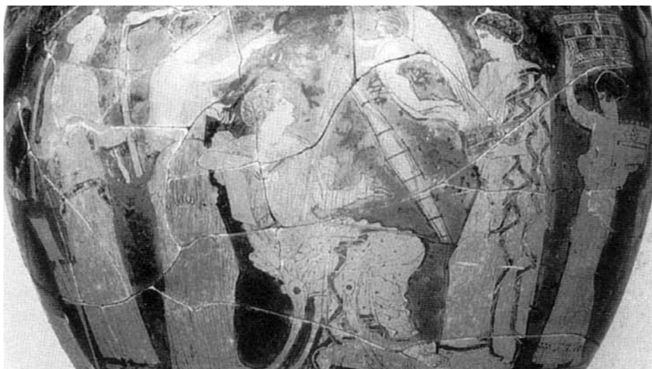
3. Particolare di un lebete a figure rosse con suonatrice di trigōnos. (da West 2007, tav. 22).