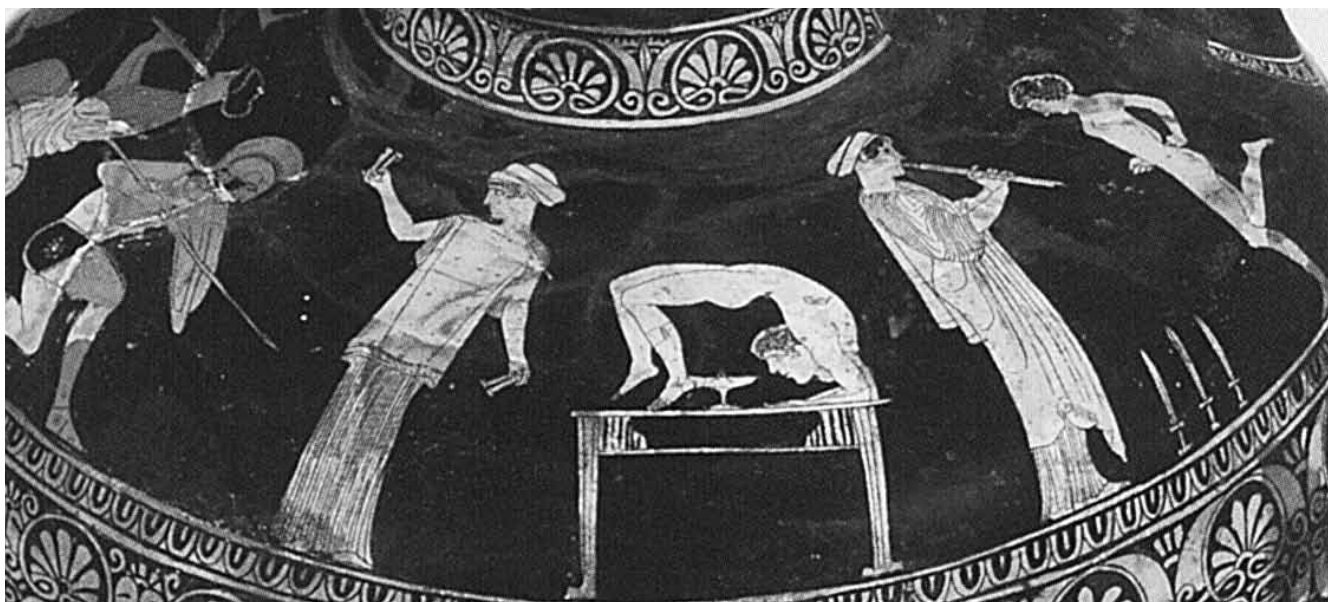
4. Particolare di hydria con suonatrici di aulos e krotala ed esecuzione di danza pirrica e di danza delle spade (Museo Archeologico Nazionale di Napoli, inv. 81398).

[Gaio Giulio Philios a Gaio Giulio Eros salute.]