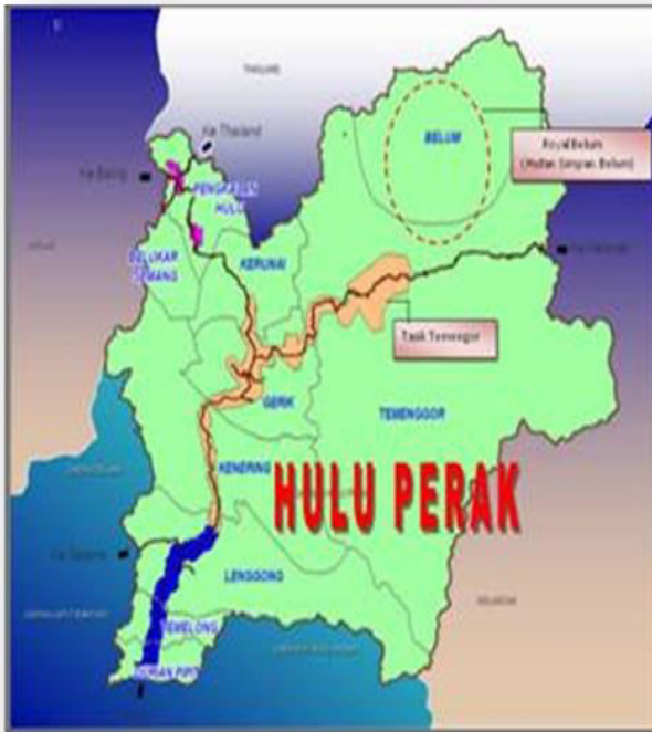
Sumber: Diubahsuai dari Rancangan Tempatan Daerah Hulu Perak, 2002-2015, Majlis Daerah Gerik, Hulu Perak