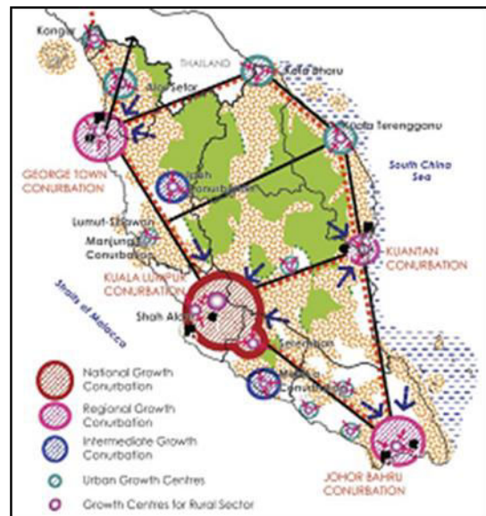
Sumber: Rangka Tindakan Sosioekonomi, Wilayah Ekonomi Koridor Utara, 2007-2025