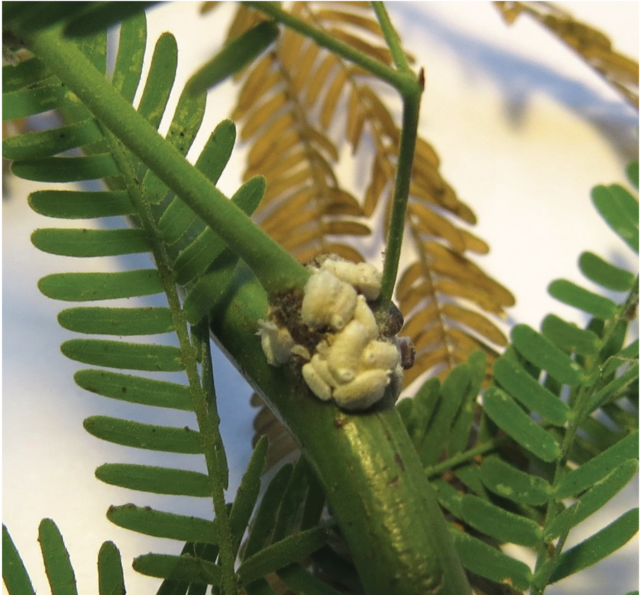
Figura 2. Grupo de hembras de Hempelicoccus alba sp. nov.