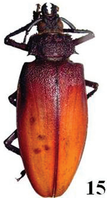
Figuras 13–15. Especies de Cerambycidae; Habitus de adultos: 13) Polyrhaphis spinosa (Drury, 1773); 14) Nicias alurnoides (Thomson, 1857); 15) Ialysus tuberculatus (Olivier, 1795).