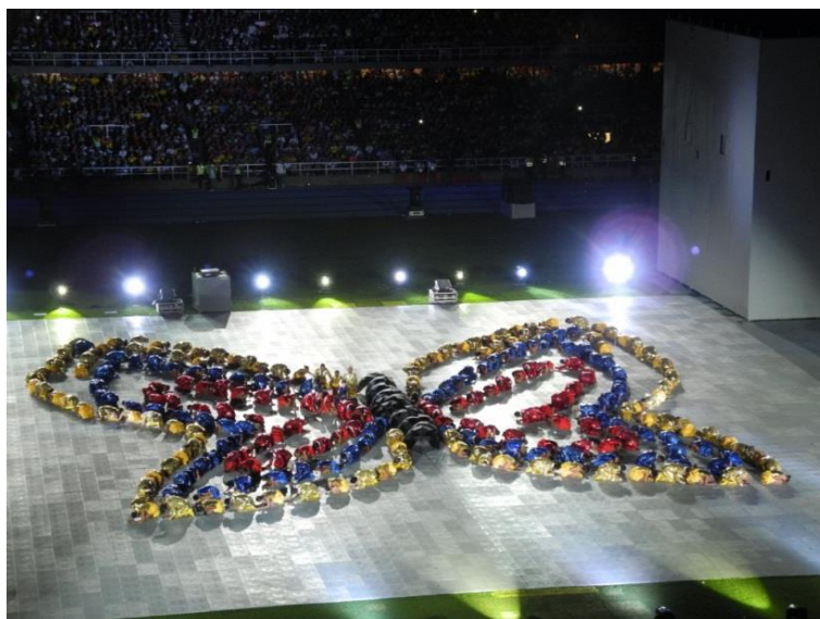
FOTO 4. Imagen representada por los bailarines durante la inauguración de los Juegos Mundiales Cali 2013