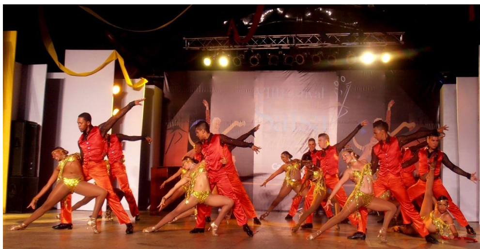
FOTO 3. Combinación Rumbera en el Festival Mundial de Salsa Cali 2013

En: http://pensar-san.blogspot.com/2013/10/combinacion-rumbera.html